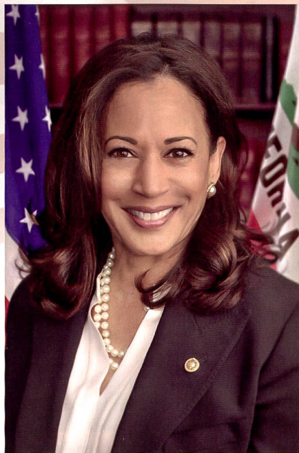
Vize-Präsidentin Kamala Harris.

bereiten Verbündeten suchte, die ihr sicherheitspolitisch zur Seite stehen würden.