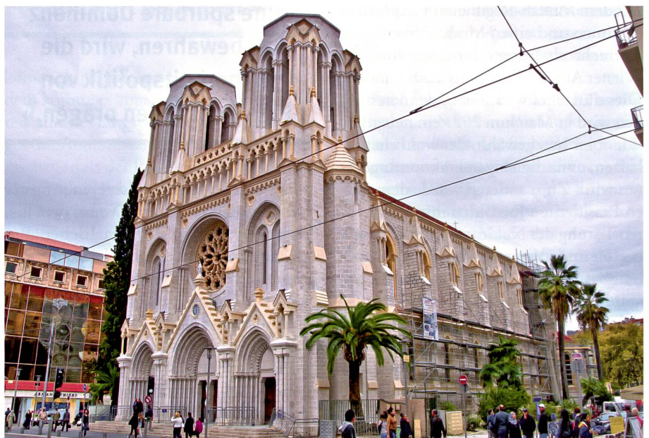
Basilique Notre-Dame de Nice.