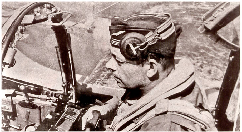
Antoine de Saint-Exupéry (1900–1944):

Führung ist nicht Selbstzweck, sondern Mittel zum Zweck. Am Schluss zählt auch in der Armee der erfüllte Auftrag. Dazu braucht es klares Verständnis der aktuellen bzw. künftigen Bedrohungen, Risiken und Gefahren, gegen welche die Armee zum Einsatz kommt. Ferner braucht es eine mit den notwendigen Mitteln und Fähigkeiten unterlegte Einsatzdoktrin sowie einsatzbereite Kräfte. Nicht jede Voraussetzung ist jederzeit voll gegeben. Klaffen aber zu grosse oder zu langlebige Lücken, ist nicht nur das Gesamtsystem in Frage