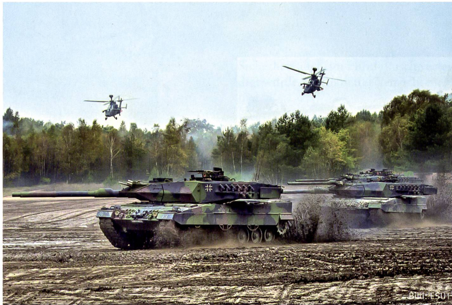
Die Rückkehr der Bundeswehr zur vollen Einsatzbereitschaft ist notwendig.

des Kalten Krieges erkennbar. Heute muss auch danach gefragt werden, welche Rolle Multinationalität und gesamteuropäische Vorstellungen in der gegenwärtigen Struktur spielen, und wie sie sich auswirken könnten. Auf der Korpssebene hat heute die Multinationalität Einzug gehalten, wie dies unter anderem in Münster, Strassburg und Stettin sichtbar ist.