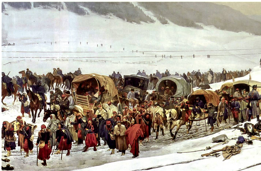
Internierung der Bourbaki-Armee.

Die Nord- und Süddeutschen führten Krieg gegen das Empire. Am 2. September 1870 kapitulierte Kaiser Napoleon III in