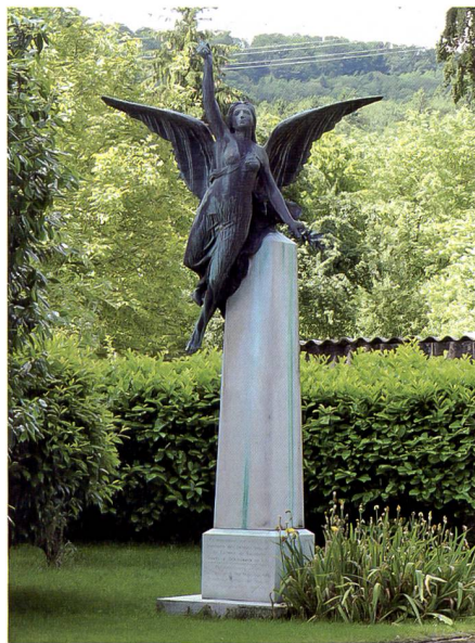
Bourbaki-Denkmal, Birr AG.

zeitig den Aufmarsch der deutschen Söldarmee unter Edwin von Manteuffel gegen den Raum Frasné, den heutigen TGV-Bahnhof. Dort kam es am 30./31. Januar 3 zu Kämpfen. Bourbakis Selbstmordversuch war vorausgegangen, eine Verzweiflungstat. Das Kommando hatte er an Justin Clinchant (1820 bis 1881) übergeben. Clinchant, der keine Rückzugsmög-