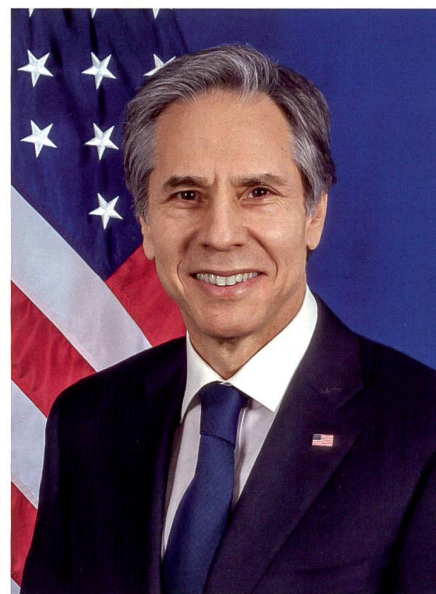
Antony Blinken, US-Aussenminister.