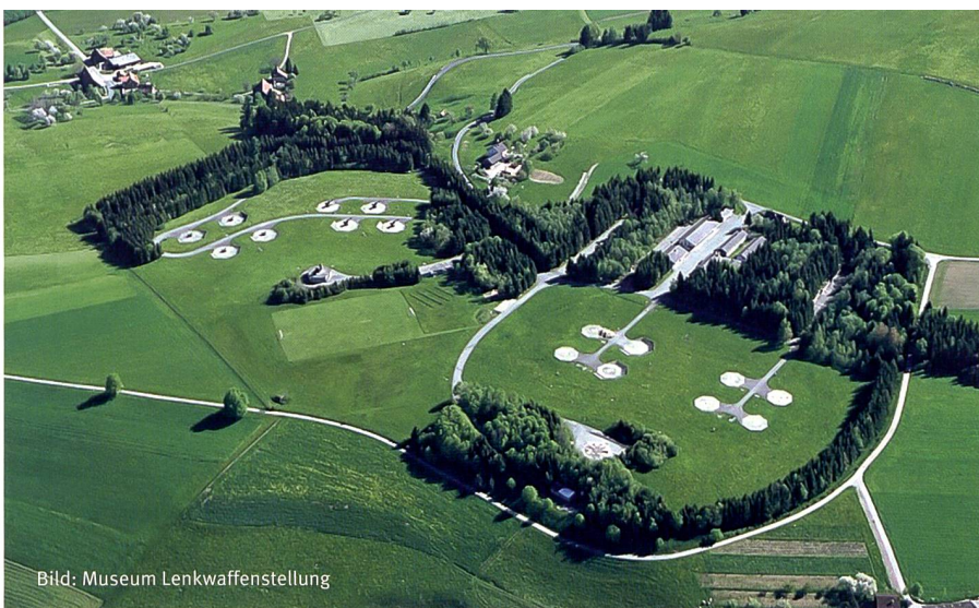
Waffenstellung