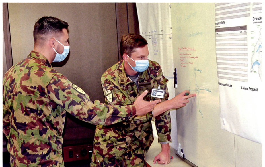
Offiziere der MILAK während einer Krisenstabsübung, angeleitet durch die Experten von der Organisation ARABELLA.