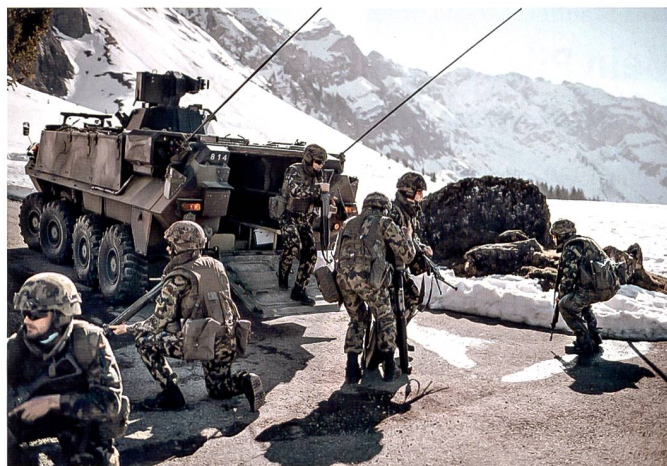
Inf Bat 61 im Einsatz.

Nicht nur die besonderen Umstände, sondern auch die zahlreichen Nachtschiessen und der durch die Lsp und BelG in helles Licht gehüllte Alpstein wird der Truppe und der zivilen Bevölkerung von diesem Dienst in besonderer Erinnerung bleiben. Der