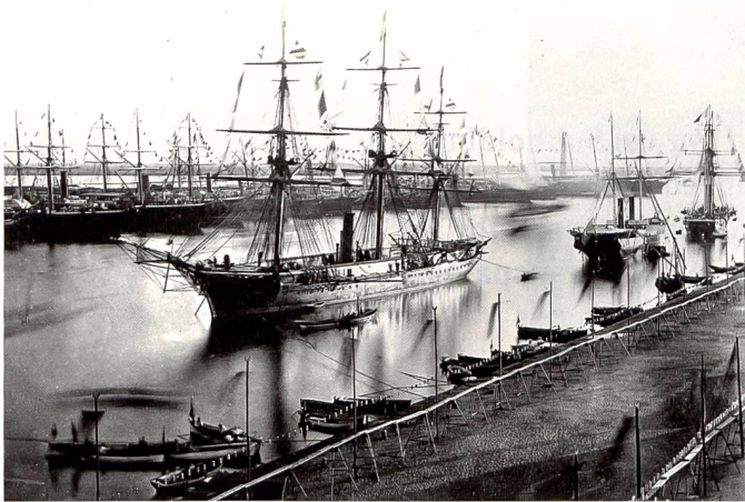
Eröffnung des Suezkanals am 17. November 1869.