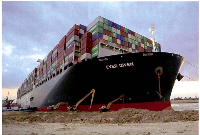
Containerschiff Ever Given blockiert den Kanal.