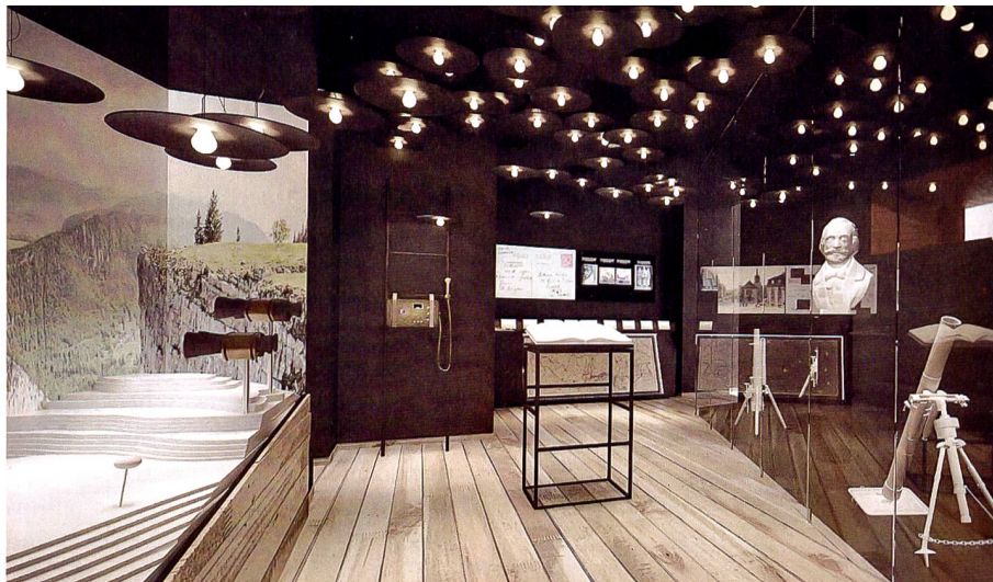
Die Ecke der in der Tiefe gestaffelten Infanterieforts und der Beobachtungsposten.

schiedene Aspekte mittels Touchscreens betrachten (mehrere Ansichten sind simultan möglich).