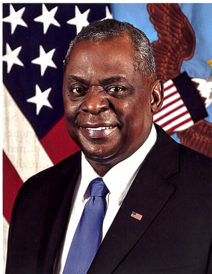
US-Verteidigungsminister Gen aD Lloyd Austin.