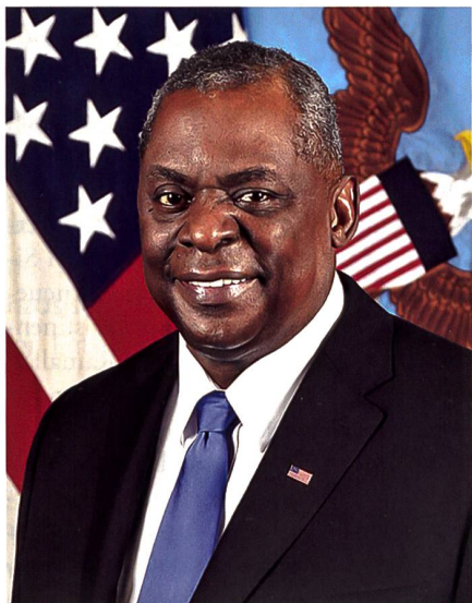
US-Verteidigungsminister Gen aD Lloyd Austin.