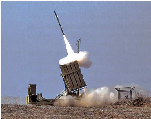
Israelische Raketenabwehr Iron Dome.

sonsten wird die Welt alles andere als ruhig bleiben», drohte er. 12 US-Aussenminister Antony Blinken sprach in Bezug auf die chinesische Politik gegenüber der muslimischen Minderheit Uiguren: «Wir sehen es an dem Völkermord, der an den überwiegend muslimischen Uiguren und anderen ethnischen und religiösen Minderheiten in Xinjiang begangen wird». 13