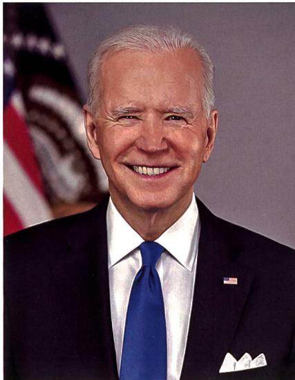
US-Präsident Joe Biden.

Die Corona-Pandemie hat die bestehenden geökonomischen Konflikte zwischen den USA und China nochmals ver-