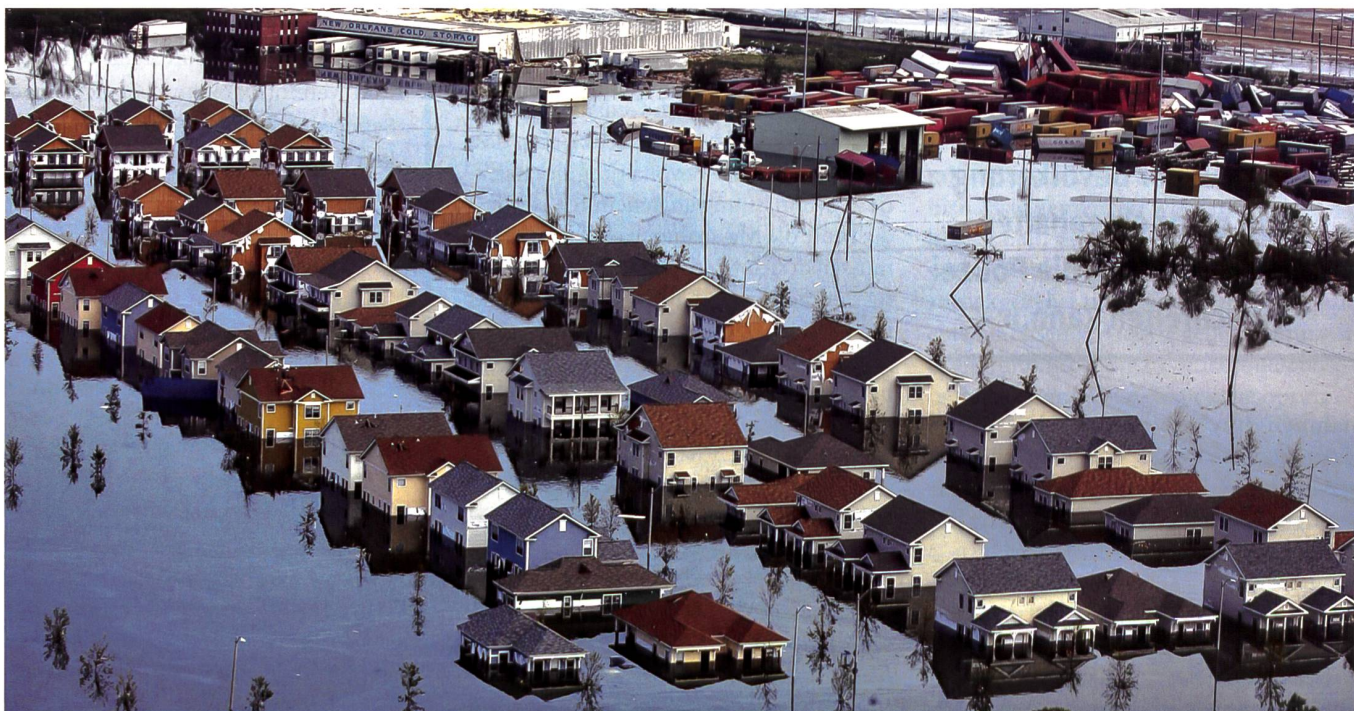
Überschwemmung der Stadt New Orleans als Folge des Hurrikan Katrina.

Allen reagierte auf diese Problematik mit Anwendung seines eigenen fünfstufigen post-disaster protocol, welches vor al-