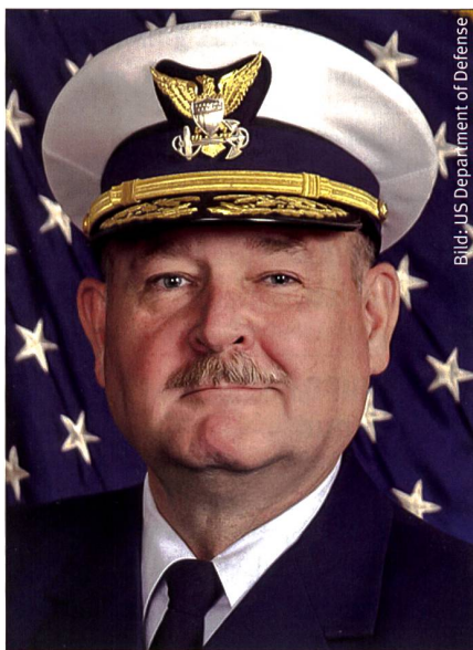
Admiral Thad Allen.