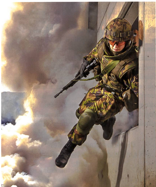
Gemischte Teams erbringen bessere Leistungen – auch in der Armee.

mee. Einen solchen Qualitätsverzicht im Bereich Sicherheit kann sich weder die Schweiz noch ein anderes Land leisten. Darum hätte die Armee, ihrem Auftrag entsprechend, von sich aus bereits vor Jahrzehnten konkrete Massnahmen zur Fraueninklusion treffen müssen. Nicht nur bei Selbstverständlichkeiten wie der gleichwertigen Infrastruktur, passender Ausrüstung oder der inklusiven, wertschätzenden Kultur. Doch bis heute fehlen Massnahmen.