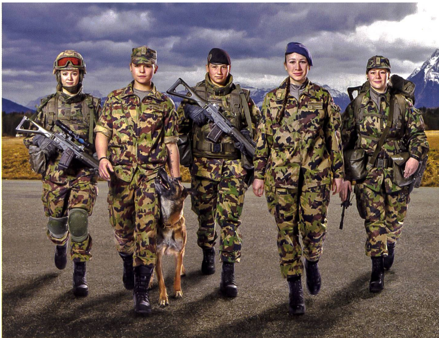
Gemeinsam sind wir stärker!

zum Stimmrecht, dass mit dem Begriff «Schweizer» neu vom Gesetzgeber überall auch die «Schweizerinnen» mitgemeint sind. Aufgrund der sehr starken und bis heute anhaltenden unbewussten Vorurteile und Stereotypen (besser bekannt unter Unconscious Bias) wurde dieser logische und auf der Hand liegende Schritt aber nicht gewagt. Im Gegenteil, sogar bundesgerichtlich bestätigt wurden im Bereich Verteidigung und Armee auch nach Einführung des Diskriminierungsverbots von 1981(!) die Männer mit einer Dienstpflicht diskriminiert und die Frauen im Gegenzug aus der sicherheitspolitischen Ausbildung ausgeschlossen. Und damit auch von der faktischen Partizipation an einem relevanten Teil Wissen und Macht. Was sich nicht zuletzt auch im Parlament zeigte.