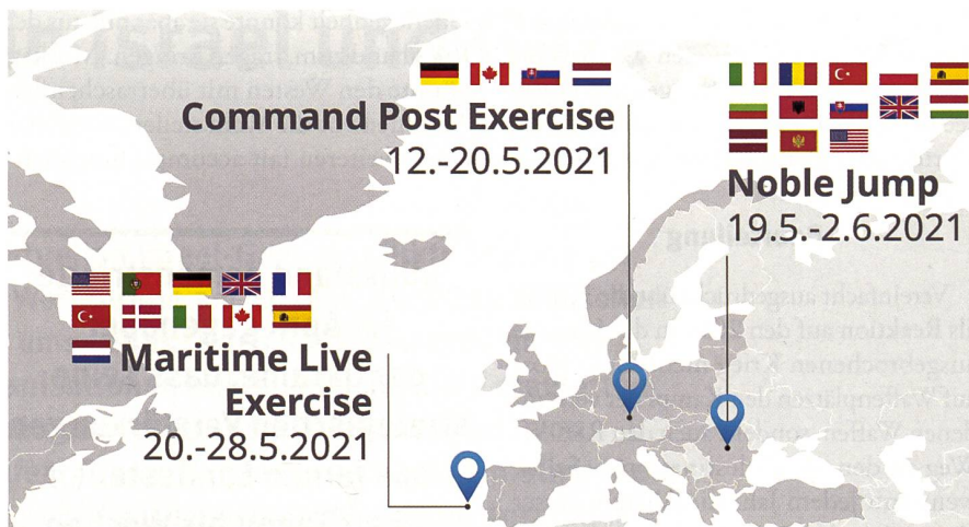
Steadfast Defender 2021 und untergeordnete Übungen.

Focșani-Passage 4) im Rahmen von Steadfast Defender.