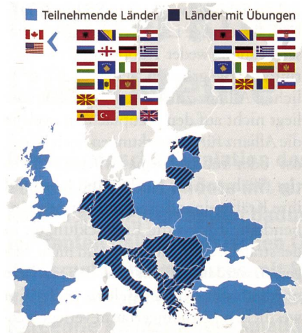
Teilnehmende und austragende Länder.