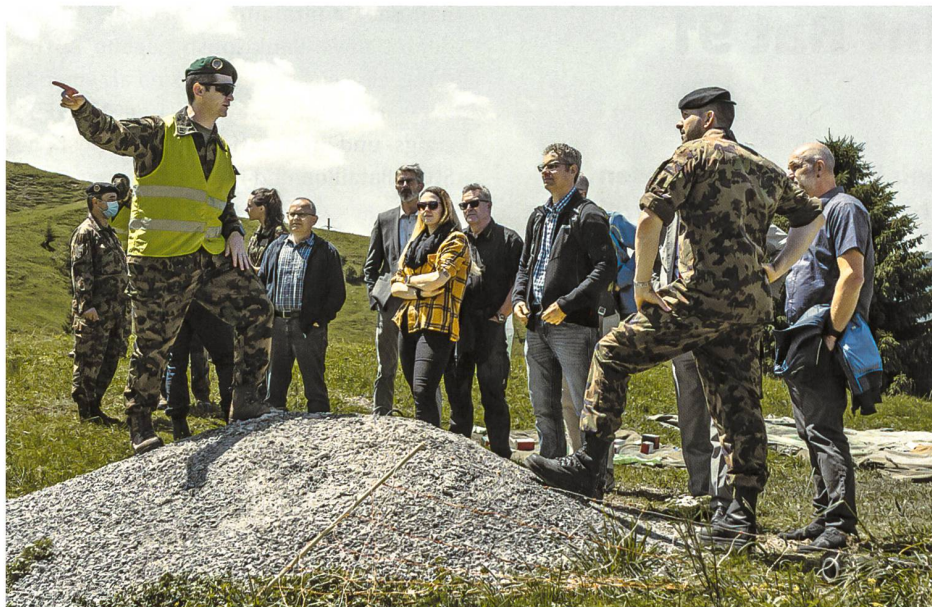
Der Behördentag fand Ende der zweiten WK-Woche statt. Bilder Stab Geb Inf Bat 91

onsweg stellt in Sachen Schnelligkeit und Effizienz einen erheblichen Vorteil zu der ursprünglichen Vorgehensweise dar, denn mit FIS HE erhalten alle Nutzer nahezu gleichzeitig das aktuelle Lagebild Boden, Schlüsselnachrichten oder sogar den Grundentschluss des Kommandanten.