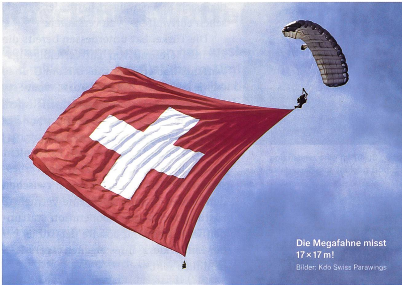
Die Megafahne misst 17 × 17 m!