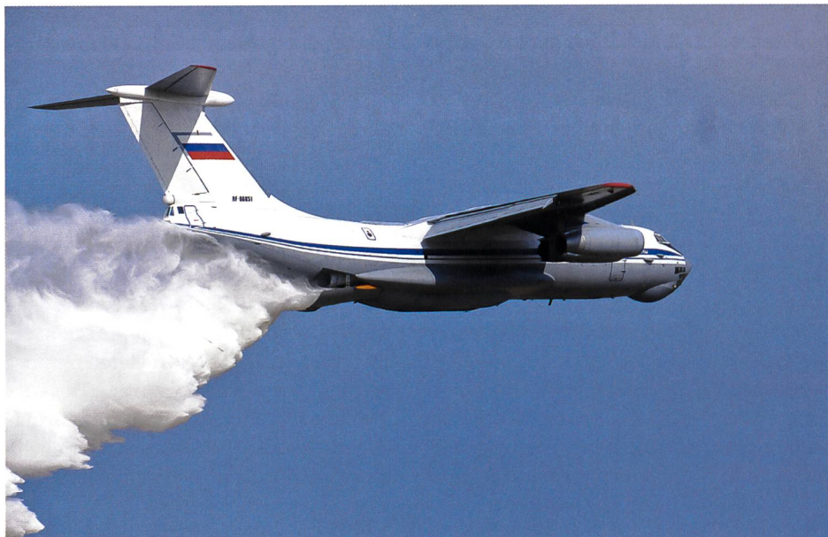
Demonstration eines Löschflugzeuges des russischen Ministeriums für Notfallsituationen.