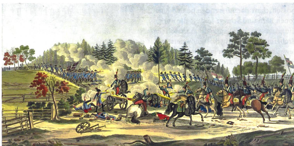
Schlacht von Fraubrunnen 1798.

Auch bei diesen regelmässig stattfindenden eidgenössischen Schützenfesten trafen sich Männer aus verschiedenen Regionen der Schweiz zum geselligen Zusammensein und leisteten im Zusammenspiel mit anderen eidgenössischen Vereinen als ideale Plattformen des politischen Meinungsaustausches einen nicht zu unterschätzenden Beitrag für ein nationales Bewusstsein, das es im sogenannten Ancien Régime – wenn überhaupt – nur ansatzweise gegeben hatte. 16