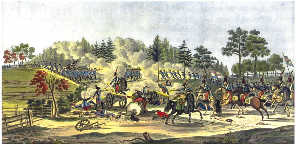
Schlacht von Fraubrunnen 1798.

Auch bei diesen regelmässig stattfindenden eidgenössischen Schützenfesten trafen sich Männer aus verschiedenen Regionen der Schweiz zum geselligen Zusammensein und leisteten im Zusammenspiel mit anderen eidgenössischen Vereinen als ideale Plattformen des politischen Meinungsaustausches einen nicht zu unterschätzenden Beitrag für ein nationales Bewusstsein, das es im sogenannten Ancien Régime – wenn überhaupt – nur ansatzweise gegeben hatte. 16