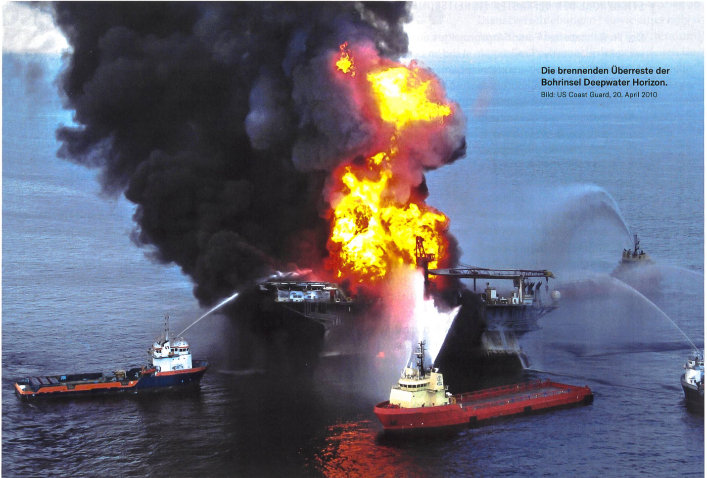
Die brennenden Überreste der Bohrinself Deepwater Horizon. Bild: US Coast Guard, 20. April 2010