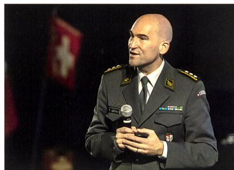
▲▲ KKdt Thomas Süssli, Chef der Armee.