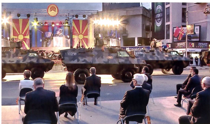
Jubiläumsparade in Skopje.

Albanien und Montenegro, Garant für den Frieden in Bosnien und Herzegowina wären. Dort droht eine Abspaltung des serbischen Teils, der von Serbien und Russland unterstützt wird. Zudem konnte der ewig währende Sprachkonflikt mit Nachbarin Bulgarien am Westbalkan-Gipfel im September nur scheinbar gelöst werden. Bulgarien beansprucht die Sprachhoheit für das auch in der Republik Nordmazedonien gebrauchte Ostsüdslawisch. Dort will man aber nichts davon wissen, bloss einen bulgarischen Dialekt zu sprechen. Dilemma: Bulgarien blockierte 2020 per Veto den Antrag auf EU-Aufnahme aus Skopje. Das Land musste erst vor zwei Jahren seinen Namen – infolge Streitigkeiten mit Griechenland – ändern. 30 Jahre nach seiner Loslösung von Jugoslawien und Erlangung der Unabhängigkeit bleibt also vieles ungelöst. Immerhin, so der EU-Aussenbeauftragte Josep Borrell, könnte die Frage um die EU-Mitgliedschaft von Nordmazedonien (zusammen mit Albanien) den entscheidenden Treiber für eine langfristige Versöhnung auf dem gesamten Balkan bringen. Borrell geht davon aus, dass damit Anreize für Serbien und Kosovo geschaffen werden, die dann möglicherweise einen direkten Effekt auf die Bosnienfrage hätten, womit «der Weg zur Lösung all dieser unerschwelligen Konflikte geebnet würde».