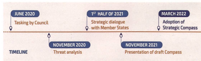
Zeitstrahl «Strategiekompass».

Dem ganzen Projekt wurde denn auch die Etikette «Strategiekompass» angeheftet. Womit die EU ihre Mitgliedstaaten verpflichten will, «zugehörige Mittel und die notwendigen strategischen Voraussetzungen bereitzustellen», so Borrell. Wie das konkret aussieht, ist noch