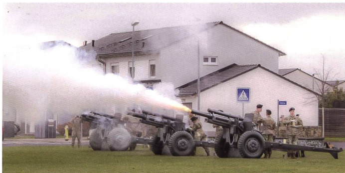
Zeremonie zur Reaktivierung in Wiesbaden.

Die US Army will ihre Feuerführung und damit verbundene Koordination in Europa wieder hochfahren. Dazu wurde das 56. Artilleriekommando am Standort Mainz-Kastel in Deutschland reaktiviert. Kommandant des Verbandes ist Generalmajor Stephen J. Maranian. Dazu meinte der Zweisternegeneral anlässlich der Feierlichkeiten anfangs November, «die Reaktivierung des 56. Artilleriekommandos wird die US Army Europe and Africa mit bedeutenden Fähigkeiten für Multi-Domain-Operationen ausstatten». Seine Einheit steht in langer Tradition, wurde während des Zweiten Weltkriegs gegründet,