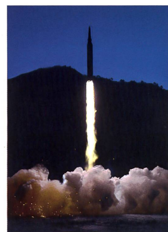
Dieses Bild von einem Raketenstart veröffentlichten Nordkoreas Staatsmedien.

Dem kommunistischen Land sind Tests von Raketen und Atomwaffen nach einer Resolution des UN-Sicherheitsrats untersagt. Verhandlungen mit dem