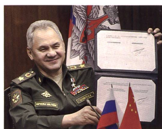
Verteidigungsminister Shoigu mit dem Vertrag.

Im November unterzeichneten Russland und China ein Abkommen, das die zukünftige militärische Zusammenarbeit bis 2025 regelt. Es bestehe ein übergeordnetes Interesse beider Länder, sich gemeinsam enger um ihre sicherheitspolitischen Herausforderungen zu kümmern. «China und Russland sind seit vielen Jahren strategische Part-