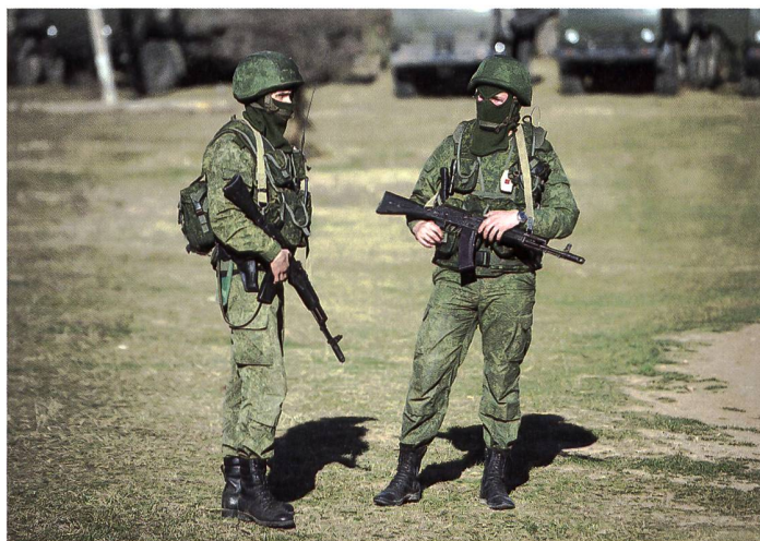
▲ Die «grünen Männchen» – Soldaten ohne Hoheitsabzeichen – waren bei Russlands Annektierung der Krim omnipräsent.