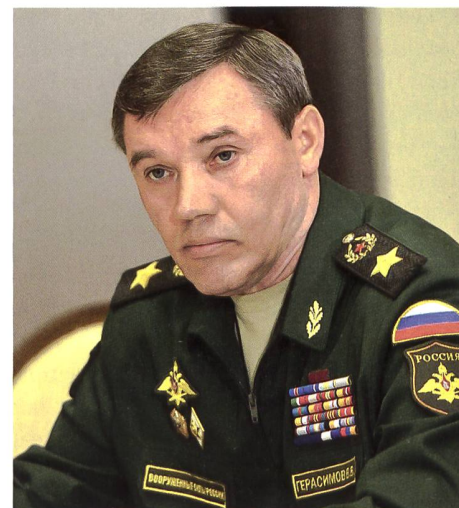
► Der russische General Waleri Gerassimow.