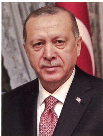
▲ Der türkische Präsident Recep Erdogan.

Die Aussen- und Sicherheitspolitik der Türkei sorgt bei zahlreichen Politikern von EU- und NATO-Mitgliedsstaaten immer wieder für «Erstaunen» beziehungsweise «Empörung». Da die türkische Regierung als realpolitischer Kenner der EU bewertet werden kann, ist davon auszugehen, dass solche Formen von Aussen- und Sicherheitspolitik auch mittelfristig immer wieder von der Türkei angewendet werden. ■