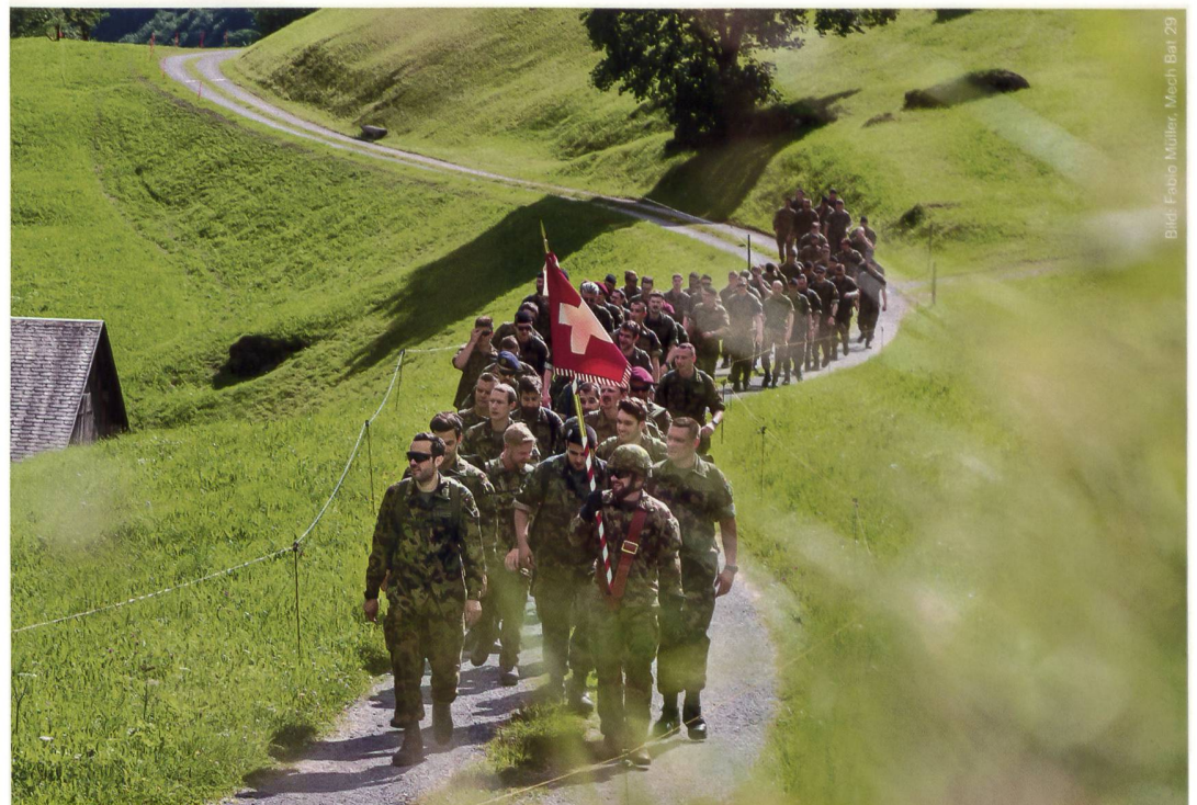
In einem eineinhalbstündigen Marsch gelangten die Offiziere der Mech Br 11 zum Rapport auf der Wichlenalp (GL).

Ab dieser Ausgabe erscheint der Veranstaltungskalender zweimonatlich. Aktuelles finden Sie unter: https://www.asmz.ch/fileadmin/asmz/Online.pdf