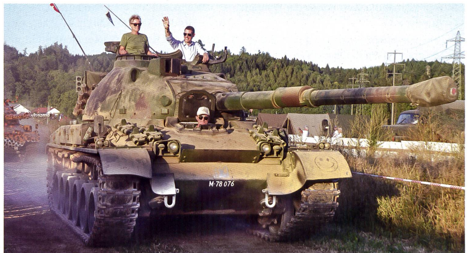
Ständerat und FDP-Präsident Thierry Burkart bringt eine Grussbotschaft und winkt vom alten Schweizer Panzer 68.