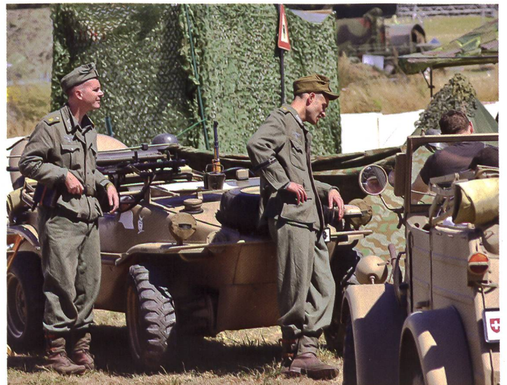
Auch die «Gegenseite» war am Treffen gut vertreten.