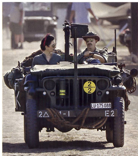
Auffallend viele Frauen waren im Look der 1940er-Jahre zu sehen.