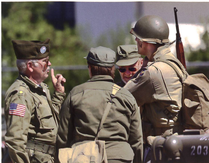
Die Teilnehmer stammten aus verschiedenen europäischen Ländern.