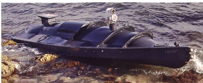
◀ Ein bereits im September 2022 auf der Krim gestrandetes USV der Ukraine. Mit solchen unbemannten Drohnen sollen am 29. Oktober 2022 russische Kriegsschiffe im Marinestützpunkt von Sewastopol angegriffen worden sein.

Seither wird festgestellt, dass die Aktivitäten der Schwarzmeerflotte beträchtlich zurückgefahren worden sind, dass Einheiten zwar in Sewastopol verbleiben und damit die Gefahr von Abschüssen der ballistischen Lenkwaffen des Typs «Kalibr» eher zurückgehen, dass auch amphibische Landeaktionen derzeit eher unwahrscheinlich sind und dass aber Russland mehrere Einheiten – offenbar aus Respekt vor weiteren ukrainischen Angriffen dieser Art – von Sewastopol ins östlich gelegene Novorossiysk