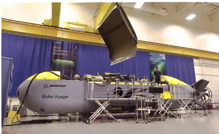
◀ Auch die USA entwickeln eine Vielzahl von unbemannten Systemen für verschiedenste Einsatzzwecke, wie hier die UUV «Orca» für die Navy.