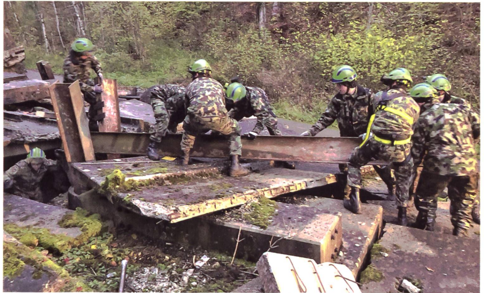
▲ Trümmer des Mehrfamilienhauses in Oberwiesen/Schleitheim werden maschinell und auch manuell entfernt, um darunterliegende Verletzte und allfällige Opfer zu bergen.

Vereinzelt wurde die Bildung von Bürgerwehren beobachtet, da Polizei und Grenzwachtkorps überfordert waren. Die Durchhaltefähigkeit der zivilen Organisationen war zunehmend infrage gestellt. Die Armee stand im Assistenzdienst. Es kam regional zu subsidiären Einsätzen unter der Führung der Kantone, so auch in Schaffhausen. Flüchtlingsdruck und illegale Grenzübertritte an den nordöstlichen Landesgrenzen nahmen weiterhin kontinuierlich zu. In Schaffhausen, Winterthur und Zürich kam es wiederholt zu Zusammenstössen zwischen verfeindeten Gruppierungen. Brand-