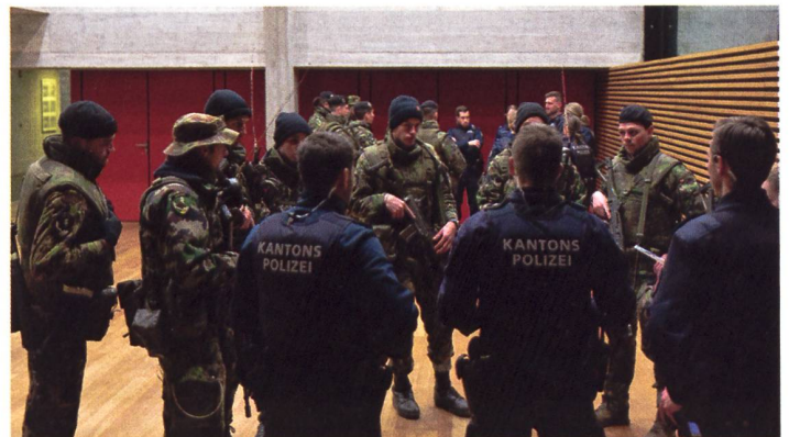
Vertreter der Kantonspolizei Aargau instruieren die Soldaten über ihren bevorstehenden Einsatz.