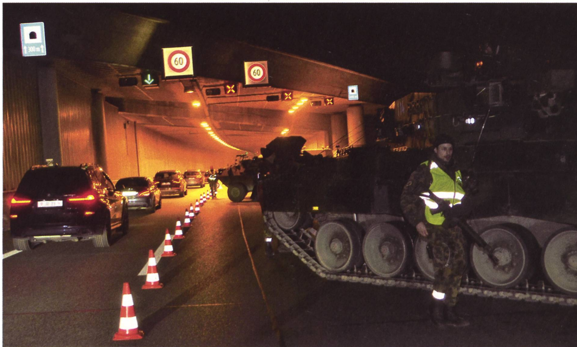
◀ Zwei der drei Fahrspuren werden eingangs Bareggtunnel durch einen Leopard 2 Kampfpfänger gesperrt.