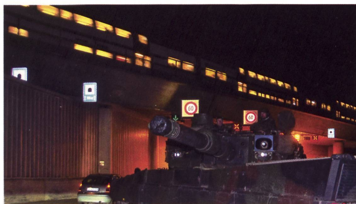
Der Kampfpfänger machte bei der Kontrolle besonderen Eindruck.