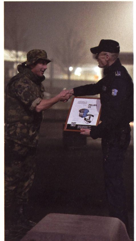
Nach der erfolgreichen Grosskontrolle am Baregg erhalten die Armeeangehörigen einen Dank der Kantonspolizei Aargau.

Auch für den Gesamtübungsleiter Divisionär Wellinger war es ein weiteres gelungenes Puzzleteil, um herauszufinden, ob ein