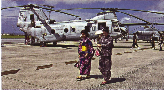
Die Bevölkerung besichtigt Helikopter der US-Marines auf einem Flugfeld in Okinawa.

Japan plant, die in Okinawa stationierte Armee auszubauen, um sich so auf einen möglichen Konflikt zwischen China und Taiwan vorzubereiten. Bereits im März dieses Jahres wurde über einen Ausbau der Verteidigung in der Region nachgedacht – als Reaktion auf Chinas verstärkte Präsenz. Das Verteidigungsministerium plant, die Anzahl der Infanterieregimenter der 15. Brigade der Bodenselbstverteidigungskräfte auf zwei zu erhöhen und den höchsten Rang der Brigade vom Generalmajor zum vollen General aufzuwerten. Der Ausbau der Armee in Okinawa