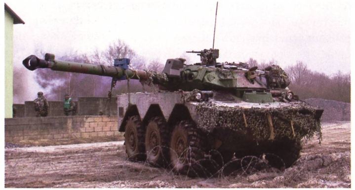
Frankreich wird der Ukraine Spähpanzer AMX-10 RC – im Bild ein Exemplar des 1er Régiment de Spahis – liefern.

den vergangenen Wochen zugenommen hatten. Ziel des Befehls an die Armee war es, «alle serbischen Bürger zu schützen und Pogrome und Terror gegen Serben zu verhindern», sagte der serbische Verteidigungsminister Milos Vučević. Belgrad liess eine Batterie Haubitzen an die Grenze zum Kosovo liefern. Im Norden des Kosovo lebt die grösste serbische Gemeinschaft ausserhalb Serbiens. Kosovo mit