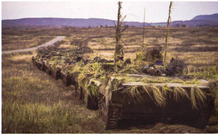
Neu in der Ukraine: slowakische BVP-1.

an. Frankreich hebe die Unterstützung für die Ukraine damit «auf ein neues Level», erklärte er in einer Videoansprache. «Und ich danke Präsident Macron für diese Führungsrolle.» Kurz darauf wurde bekannt, dass auch die Vereinigten Staaten über eine Ausweitung der Waffenhilfe nachdenken. US-Präsident Joe Biden verkündete die Lieferung von Schützenpanzern vom Typ Bradley. Deutschland sagte kurz darauf die Lieferung von bis zu 40 Schützenpanzer Marder zu. Knapp eine Woche später legten die Briten noch einen obendrauf: Sie wollen der Ukraine 14 Kampfpanzer des Typs Challenger 2 übergeben. Damit gerät Deutschland immer mehr unter Druck, ihr Placet zur Lieferung von Leopard 2 in die Ukraine zu geben. Polen und Finnland wollen aus ihren Beständen Leos an die Ukraine abgeben. Die Polen denken ebenfalls an 14 Exemplare. Sie brauchen dafür aber die Zustimmung des Her-