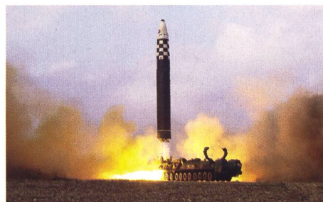
Abschuss einer nordkoreanischen Interkontinentalrakete des Typs Hwasong-17.

Seit geraumer Zeit häufen sich die Militäraktivitäten Nordkoreas. So wurden etliche Manöver mit Kampfflugzeugen und Artillerieeinheiten abgehalten und ungewöhnlich viele Raketen getestet – darunter auch erstmals seit 2017 wieder Interkontinen-