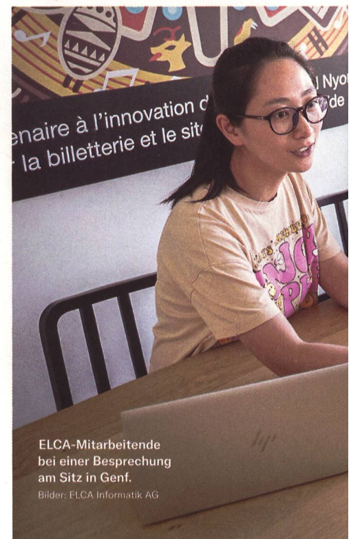
ELCA-Mitarbeitende bei einer Besprechung am Sitz in Genf.

Heute wird meist übereinstimmend festgestellt, das Militär sei nicht mehr der technologische Treiber. Wie nehmen Sie