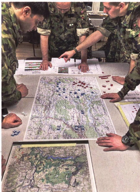
Kriegsspiel auf Gegenseitigkeit (Red-Teaming) im Rahmen des TLG 1 Pz/Art 2023.

So stellt sich mit Blick auf unser eigenes Führungsdenken die Frage, ob und wie oft Agilität und Flexibilität überhaupt gefordert werden. Und inwiefern unsere Führungsleistung daran gemessen wird, wie fähig ein Verband oder ein Team ist, rasch und selbstständig sein Vorgehen anzupassen. Und zwar nicht nur, um erkannte Risiken zu vermeiden, sondern auch um gezielt Chancen zum eigenen Erfolg zu nutzen. Mit kritischem Blick auf unzählige taktische Übungen und Simulationen fällt meist der starke Fokus auf Prozesse sowie eine ausgeprägte Detailverliebtheit in der Planung auf. Die Vorstellung, je besser die Planung, desto klarer die Befehlsgebung und umso sicherer der eigene Erfolg, scheint ein zentrales Merkmal Schweizer Führungslogik zu sein. Oft wird dabei versucht, nicht nur die technischen Friktionen einer Aktion zu vermeiden, sondern auch gleich die mit dem gegnerischen Vorgehen verbundenen taktischen Risiken zu eliminieren. So basiert