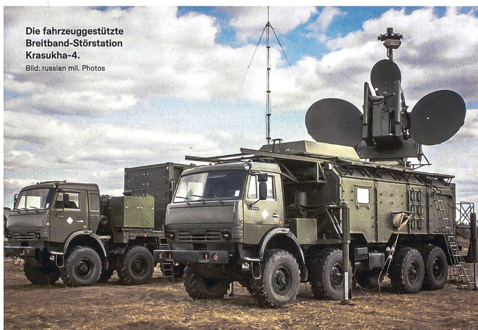
Die fahrzeuggestützte Breitband-Störstation Krasukha-4.

Laut einem vom russischen Verteidigungsministerium im Internet veröffentlichten Video, verwenden die russischen Streitkräfte in der Ukraine unterdessen ihre neusten Systeme der elektronischen Kriegsführung.