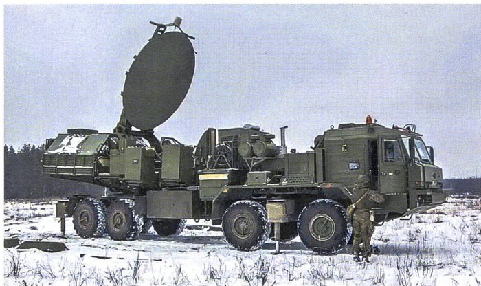
▲ Eine mobile Störstation Krasukha-2.