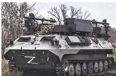
◀ Ein Schützenpanzer MT-LBU mit einer Störstation des Borisoglebsk-2-Komplexes.