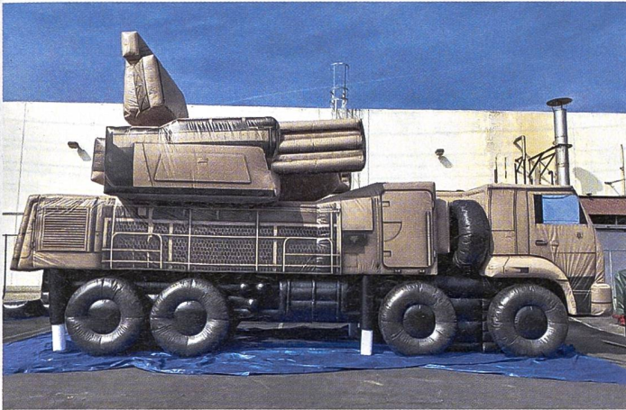
Ein russisches Pantsir-S1-Flugabwehrsystem (NATO: SA-22 Greyhound) in der aufblasbaren Variante.