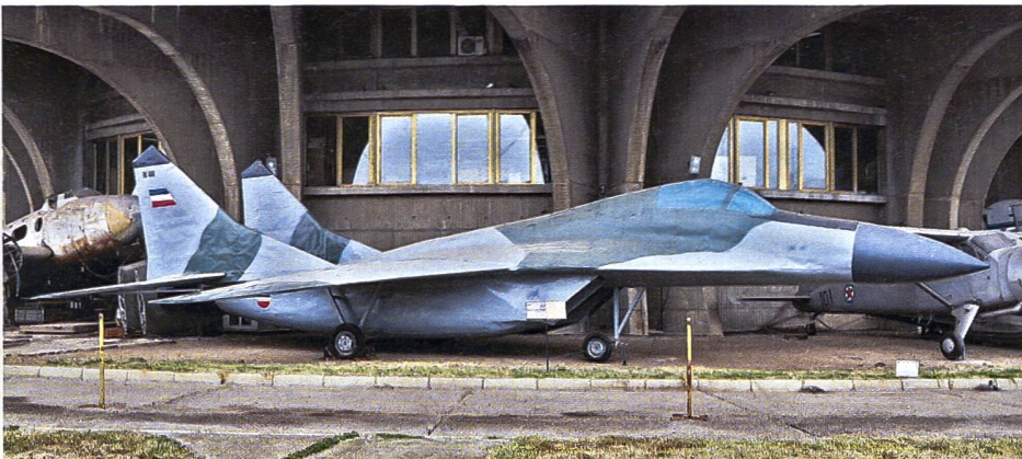
Eine Attrappe einer jugoslawischen Mig-29, die erfolgreich im Kosovo-Krieg verwendet wurde und heute – renoviert – im Luftwaffenmuseum in Belgrad zu besichtigen ist.

Grund dafür waren von Anfang an Uneinigkeiten innerhalb der obersten Führungsebene der NATO-Mitglieder, schlechtes Wetter, die stets präsenste und äusserst mobile serbische Flugabwehr und schliesslich auch die geschickt versteckten, getarnten und dislozierten Waffensysteme. Über 1000 Flugzeuge der NATO flogen während 70 Tagen über 38 000 Einsätze gegen die serbischen Stellungen und Infrastruktur. Dabei gaben NATO-Piloten an, 2000 Ziele getroffen zu haben, meist Artilleriestellungen, Panzer sowie gepanzerte Mannschaftsfahrzeuge. Als dann aber nach Beendigung der Kampfhandlungen die serbischen Einheiten den Kosovo mit unzähligen Kolonnen an Panzern, Schützenpanzern, Artillerie usw. wieder verliessen, rieben sich die NATO-Analysten verwundert die Augen: Obwohl über 28 000 Bomben und Lenkwaffen abgeworfen worden waren, konnten nach dem Krieg ganze 93 zerstörte Kampfpanzer nachgewiesen werden. Wie eine Analyse des Luftkrieges später ergab, waren die vielen Attrappen der Serben mit für die bescheide-