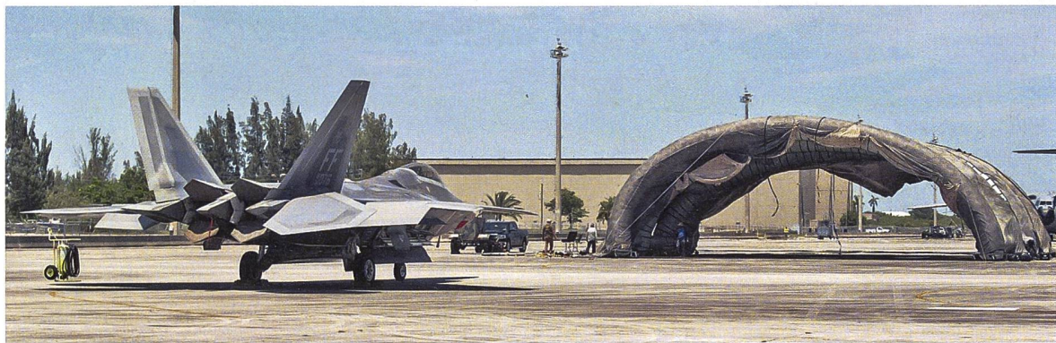
◀ Zukünftig sollen aufblasbare Hangars der US-Air-Force im Pazifikraum von den eigentlichen Zielen ablenken. Hier ein Prototyp anlässlich der Übung «Hoodoo Sea Air» der Nationalgarde im Jahr 2023.

nen Resultate dieser NATO-Kampagne verantwortlich.