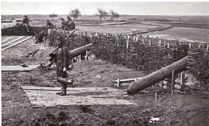
Scheinanlagen der Konföderierten mit sogenannten «Quäker-Kanonen» im US-amerikanischen Bürgerkrieg.

Erstmals wurden im grossen Stil aufblasbare Attrappen von Panzern, Flugzeugen, Lastwagen und Landungsbooten verwendet, die in Grossbritannien gegenüber dem Pas-de-Calais für die deutsche Luftaufklärung sichtbar in Position gebracht wurden. Erfolgreich wurde vom späteren Ort der geplanten Invasion – der Normandie – abgelenkt. Diese unter dem Decknamen «Fortitude South» bezeichnete Täuschungsaktion soll für Wochen zahlreiche schlagkräftige Wehrmachtsverbände am