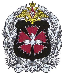
▲ Wappen der «Hauptverwaltung des Generalstabes der Streitkräfte der Russischen Föderation» (GRU); Leitspruch: «In Euren ruhmreichen Taten liegt die Grösse des Vaterlandes.»

Im April 1992 beschrieb der damalige Chef der GRU, Jewgenij Timochin, in einem Interview mit Roter Stern (Krasnaja Swesda). Die Zeitung wurde 1924 als Zentralorgan der Roten Armee ins Leben gerufen und heisst noch immer so: «Die Objekte unserer Aufmerksamkeit sind die Streitkräfte, die Technik, Bewaffnung und Einrichtung auf dem möglichen Kriegsschauplatz: das Kommunikationssystem, die Strassen, Flugplätze, Flüsse, Kanäle, die Durchlassfähigkeit der Hauptverkehrswege.» Im Jahr 2000 – also vor der Ära-Putin – stellte eine Studie der CSU-nahen Hanns-Seidel-Stiftung fest: «Strukturell und personell völlig unberührt