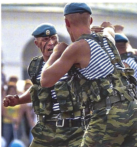
Systema: Die Nahkampfausbildung der GRU-Speznas entstand aus den traditionellen Kampfstilen der Kosaken und Slawen. Aufgrund der Explosivität ist die Effizienz unbestritten; dahinter steckt eine ganzheitliche Krieger-Philosophie. Systema unterscheidet sich von der sowjetischen/russischen Nahkampfform Sambo.

Dasselbe gilt für den Intelligence War. Er tobt wie zu Zeiten des Kalten Krieges im Hintergrund mit voller Härte. Nachrichtenbeziehungsweise geheimdienstliche Arbeit bedeutet das Sammeln von Daten und Informationen, diese zusammenzufügen, zu synthetisieren und zu analysieren. Der Grossteil davon ist leicht verfügbar, weil die Information allgemein zugänglich ist; Open Source Intelligence (OSINT) respektive Informationsgewinnung macht 80 Prozent des Materials aus, das Dienste für ein Bild der Lage benötigen. Die übrigen 20 Prozent, die besondere (konspirative) operative Massnahmen – die Informationsbeschaffung – erfordern, der Stoff von dem Spionagethriller leben, sind ein verhältnismässig bescheidener Teil. Zwar haben sich ob der allgemein fortschreitenden Digitalisierung