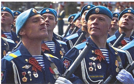
GRU-Speznas auf einer Parade: Auf den ersten Blick Fallschirmjäger – hellblaues Barett und das hellblau-gestreifte Unterhemd (Telnjashka); tatsächlich Kommandosoldaten unter Befehl der Militäraufklärung, Experten für Sabotage und Terror. Die aktive Mannstärke dürfte – wie zu besten Sowjetzeiten – an die 20 000 betragen. Die russische Armee unterhält eigene Luftlandetruppen, die nicht der GRU unterstehen.

Mit dem 24. Februar 2022 sind wir – nicht nur in Europa – in eine historische Zeitenwende eingetreten. Mit dem Zerfall des Warschauer Paktes und dem Auseinanderbrechen der Sowjetunion, wurde (vorerst) das Ende des Kalten Krieges und der bipolaren Weltordnung vollzogen. Deutliche Antworten, wie sich eine neue geopolitische Struktur entfalten könnte, lieferten die vorigen drei Jahrzehnte nicht. Wer sich der trügerischen Illusion, darunter auch hochrangige Militärs in ganz Europa, hingab, der Krieg gehöre auf unserem Kontinent endgültig der Geschichte an, wurde am 24. Februar 2022 (leider) eines Besseren belehrt. Der konventionelle, kinetische Krieg der verbundenen Waffen tobt nun seit über einhalb Jahren in Europa. Zwar mag er sich um Drohnen, Cyberwar und Electronic Warfare erweitert haben, doch am Ende bleibt das Ringen um die klassische Landnahme. Die Vorstellung vom sogenannten Cyber Soldier, der mit ein paar Mouse-Klicks die kritische Infrastruktur eines potenziellen Gegners oder ein paar Geldautomaten auf dessen Hoheitsgebiet lahmlegt und somit einem kinetischen Angriff den Wind aus den Segeln nimmt, hat sich als Hirngespinnst erwiesen.