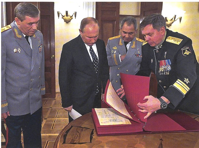
◀ 100-Jahr-Jubiläum der GRU: Anlässlich der Feierlichkeiten bewundern die Spitzen der russischen Armee historische Dokumente – Generalstabschef Walerij Gerassimow, Verteidigungsminister Sergej Schoigu, Präsident Wladimir Putin sowie GRU-Chef Admiral Igor Kostjukow (von links).