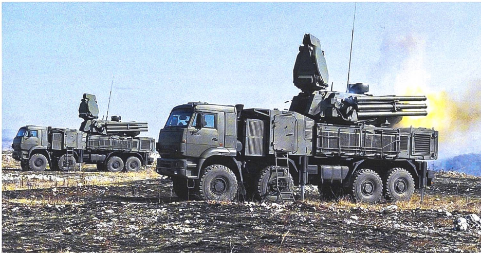
▲ Ukrainische Truppen setzen erbeutete Pantsir-S1 gegen russische Kampfhelikopter ein.