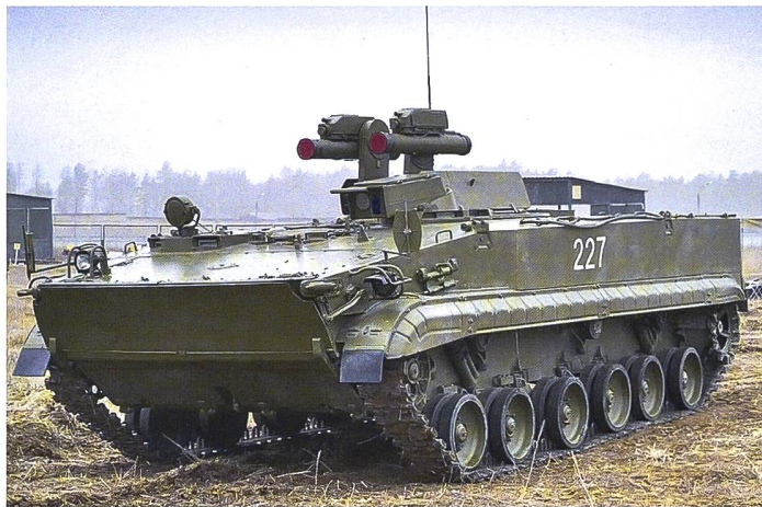
▶ Hochfahrbare Abschussvorrichtung mit PAL AT-14 Kornet auf einem Kampfschützenpanzer BMP-3.

wird auch zur Bekämpfung langsamer und tief fliegender Luftziele wie Helikopter eingesetzt.