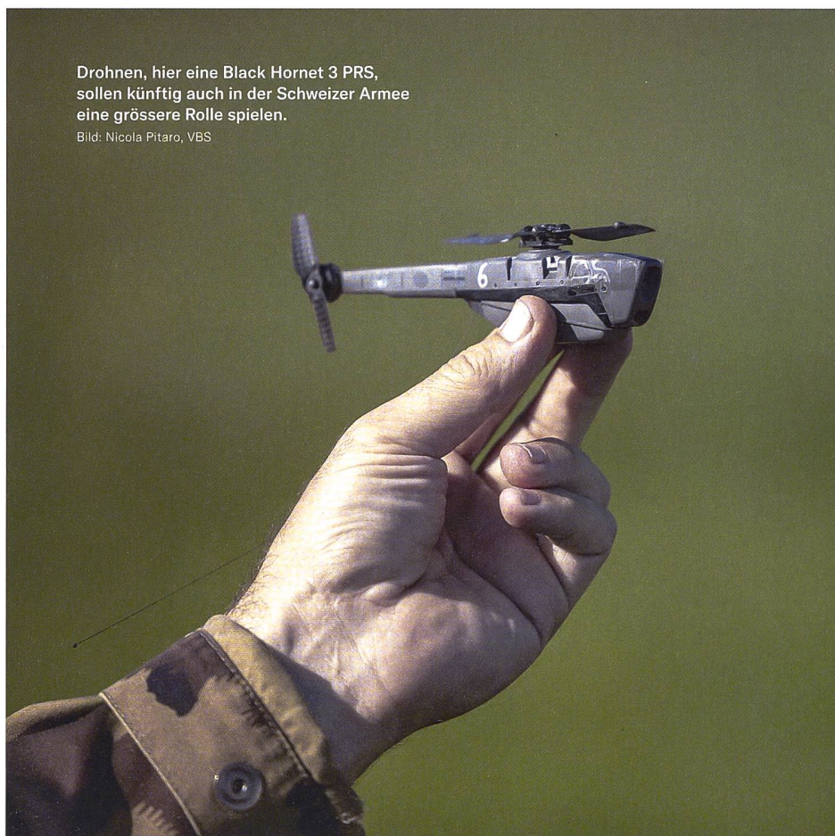
Drohnen, hier eine Black Hornet 3 PRS, sollen künftig auch in der Schweizer Armee eine grössere Rolle spielen.

Der Chef der Armee, Korpskommandant Thomas Süssli, lieferte ein ungeschöntes Bild des heutigen Zustands der Schweizer Armee: Als Produkt der Armee XXI sei man auf die wahrscheinlichsten Einsätze fokussiert; die Verteidigungsfähigkeit beschränke sich auf den Kompetenzerhalt. Mit anderen Worten: «Schützen und helfen ja, für alles Weitere fehlt das Material.» Die Bevor-