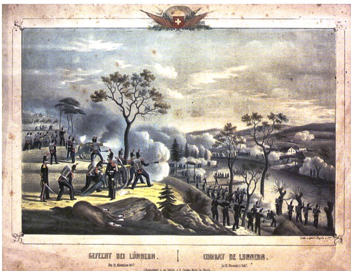
◀ Das Gefecht bei Lunnern im Sonderbundskrieg fand am 12. November 1847 statt.

Ein ähnlicher ökonomischer Graben zog sich in der ersten Hälfte des 19. Jahrhunderts auch durch die Schweiz. Die industrielle Entwicklung war in der schweizerischen Eidgenossenschaft nämlich ein einseitiges Phänomen. Sie betraf vor allem die Mittellandkantone und hier im speziellen die ländlichen, aber dennoch stadtnahen Regionen, welche bereits eine Tradition in der Textilherstellung kannten. In den Innerschweizer Kantonen hingegen blieb die Industrialisierung – von wenigen Ausnahmen abgesehen – aussenvor. Hier herrschten weiterhin die altbewährten Wirtschaftsformen wie Viehzucht und Solddienst, wobei bei letzterem vor allem die Innerschweizer Elite wirtschaftlich und machtpolitisch profitierte. 8 Aus diesen Unterschieden zwischen den wirtschaftlichen Erneuerungen gegenüber