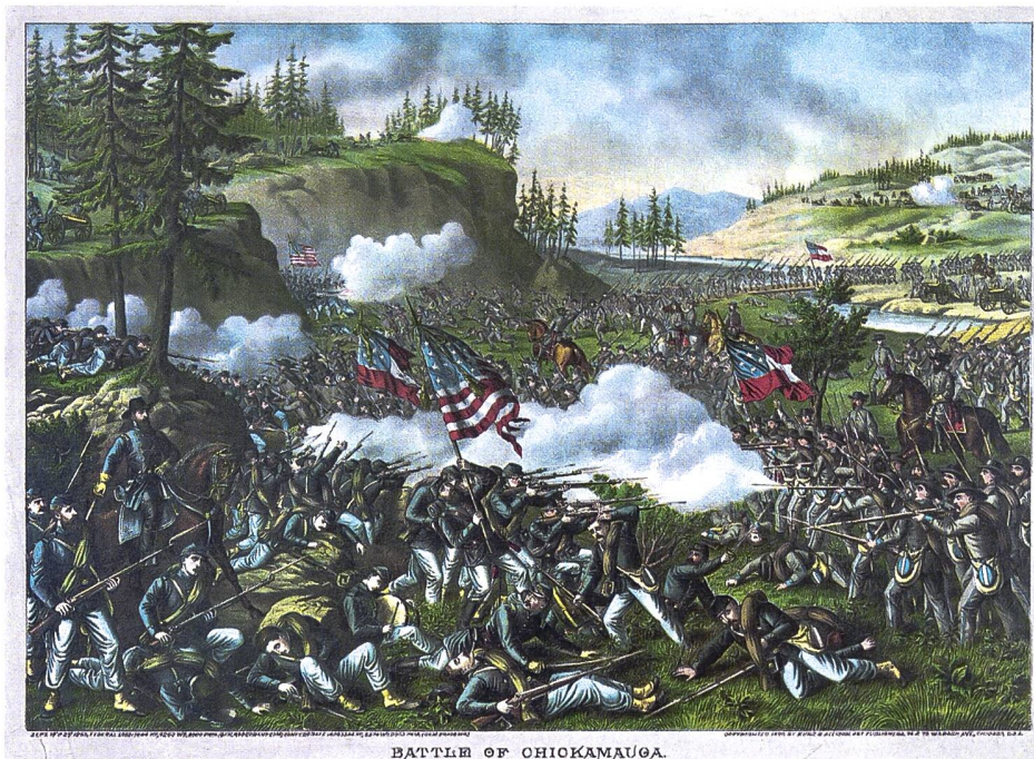
BATTLE OF CHICKAMAUGA.

Im Verbund mit den unterschiedlichen Wirtschaftssystemen standen – wie oben ange-tönt – auch die politischen Differenzen zwischen den verschiedenen Landesteilen. 10 Konservative Weltbilder traten sowohl in den USA zur Zeit des Sezessionskrieges wie