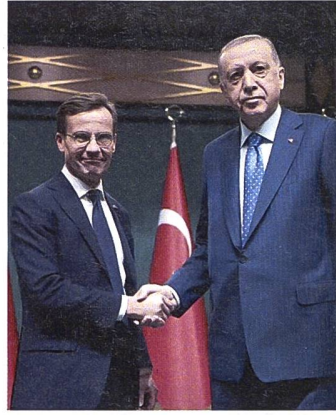
Sind sich im Grundsatz einig: Schwedens Premier und der Präsident der Türkei.

Schweden steht kurz vor dem Beitritt zur NATO. Ein Schritt, der das strategische Gleichgewicht in Nordeuropa verändern wird. Bekannt sind diesbezüglich die Reaktionen der Türkei. Präsident Recep Tayyip Erdogan hat sich, nachdem er am NATO-Gipfel in Lissabon noch seine Zusage erteilte, später gegen eine beschleunigte Aufnahme Schwedens in die NATO ausgesprochen. Erdogan argumentiert, dass Schweden zuerst seine Beziehungen zu den kurdischen Militanten klären müsse. Die Türkei betrachtet diese Gruppen als terroristische Organisationen und hat Bedenken geäußert, dass die Unterstüt-