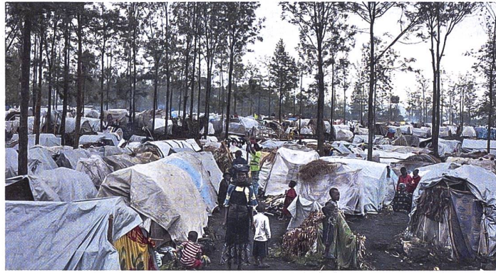
Ein Flüchtlingscamp bei Goma in der Nord-Kivu-Region.

Die Demokratische Republik Kongo steht vor einer beispiellosen humanitären Krise, da die Zahl der Binnenvertriebenen auf ein Rekordhoch von fast sieben Millionen gestiegen ist. Dies geht aus einem Bericht der Internationalen Organisation für Migration (IOM) hervor. Kongo, eines der grössten und bevölkerungsreichsten Länder Afrikas, hat in den letzten Jahren eine Reihe von bewaffneten Konflikten erlebt. Insbesondere in den östlichen Provinzen Ituri, Nord- und Süd-Kivu so-