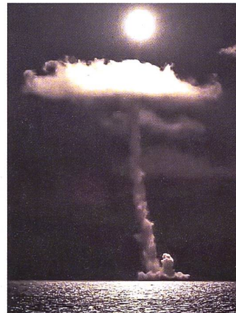
Der Abschuss einer Bulava-Rakete.

endet erklärt und zog die Ratifizierung zurück. Die EU forderte Russland deshalb auf, seine Entscheidung zu überdenken und bekräftigt ihr Engagement für den CTBT. Knapp eine Woche nach dem Rückzug hat Russland erfolgreich einen Test mit einer ballistischen Rakete von einem U-Boot aus durchgeführt, wie die russische Marine bekannt gab. Das U-Boot Karelia feuerte eine Interkontinentalrakete des Typ Bulava ab, die ihr Ziel in der Nähe Kamtschatkas im Osten Russlands traf. Der Test wurde als Teil einer regelmässigen Überprüfung der Einsatzbereitschaft des nuklearen Abschreckungspotenzials durchgeführt. Die Bulava-Rakete ist eine strategische Waffe und kann mehrere Atomsprenköpfe tragen. Sie hat eine Reichweite von bis zu 8000 Kilometern und kann Ziele auf dem gesamten Globus treffen. Dieser erfolgreiche Test soll Russlands Position als eine der führenden Atommächte der Welt stärken. Putin setzt offenbar immer mehr auf die nukleare Abschreckung. Denn angeblich habe