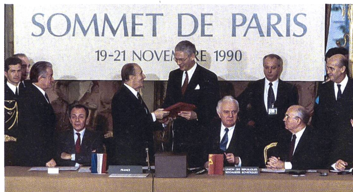
Die Unterzeichnung des CFE-Vertrags im Jahr 1990.

einer Erklärung festhielt, dass die alliierten Mitgliedstaaten in globaler Hinsicht ihre Verpflichtungen gegenüber dem CFE aussetzen werden. Die Konsequenzen dürften indes marginal ausfallen. Denn Russland hält seine Verpflichtungen gegenüber dem CFE seit 2007 nicht mehr ein. Entsprechend wird nicht erwartet, dass unmittelbare Änderungen in der Aufstellung Russlands entlang der NATO-Grenzen zu erwarten sind. Dennoch blieb der NATO keine andere Wahl. Nach langer Beratung kamen die Alliierten zum Schluss, dass eine einseitige Aufrechterhaltung des CFE keine Sinn mache und mit der Aussetzung des Vertragswerks die eigene Abschreckungs- und Verteidigungsfähigkeit massiv verstärkt werden kann. Der Vertrag wurde ursprünglich zwischen den NATO-Staaten und den Mitgliedern des Warschauer Pakts, den es bei Vertragsunterzeichnung bereits nicht mehr gab, am Pariser KSZE-Treffen im Jahr 1990 unterzeichnet und bis Ende