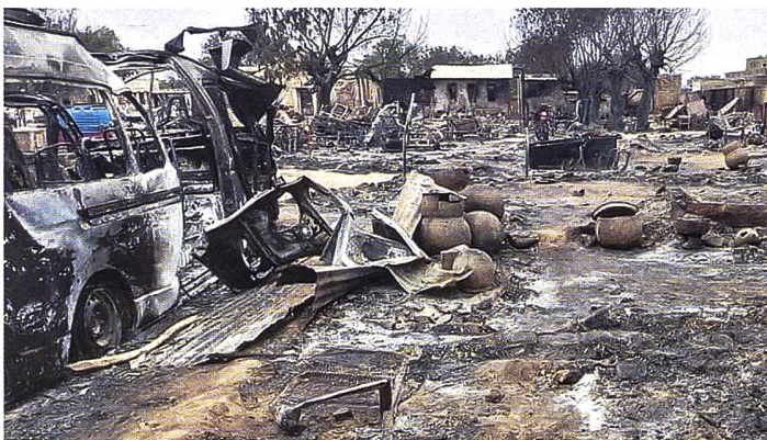
Zerstörung in Al-Fasher, Darfur.

schlimmsten Befürchtungen wahr. Innerhalb von 72 Stunden wurden laut UNO-Berichten mindestens 800 Personen des Masalit-Stammes im Rahmen einer ethnischen Säuberung durch die RSF und ihre Verbündeten in West-Darfur getötet. Den RSF, die aus den islamistischen Janjaweed Milizen hervorkamen, werden nahe Kontakte zu Qatar vorgeworfen. Angeblich wird die Miliz auch durch die prorussische Wagner-Gruppe ausgebildet. Der hohe Flüchtlingskommissar der UNO und damit Vorsteher des UNHCR, Filippo Grandi, warnt vor den Folgen der jüngsten Ereignissen: «Diese schrecklichen Handlungen verdeutlichen erneut das Muster von Missbräuchen im Zusammenhang mit militärischen Angriffen.» Er verweist dabei direkt auf den damaligen Völkermord in Darfur, bei dem zwischen 2003 und 2005 schätzungsweise 300 000 Menschen ums Leben kamen, und warnte davor, dass sich eine «ähnliche Dynamik entwickeln könnte». Seit April wurden mehr als 4,8 Millionen Menschen intern vertrieben und 1,2 Millionen sind in Nachbarländer geflohen. Laut den Vereinten Nationen flohen allein in der ersten Novemberwoche mindestens 8000 Menschen aus dem Sudan nach Tschad. pk