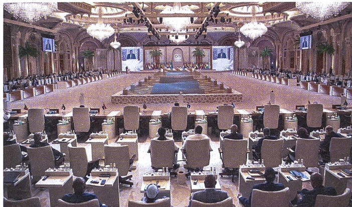
Der Gaza-Gipfel in Riad Mitte November.

zeuge, 40 000 Artilleriewaffen, 13 600 Kampfflugzeuge und 4000 Angriffshelikopter stationiert werden dürfen. pk