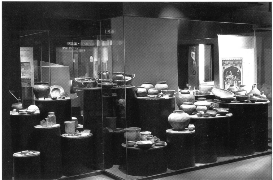
Abb. 5 Der «Küchenschrank der Geschichte» aus der Ausstellung HÖHLE-CASTRUM-GROTTENBURG im Historischen Museum Olten.

Da wir 2003 keine grösseren Ausgrabungen durchzuführen hatten, fielen auch die sonst zum Standardprogramm gehörenden «Tage der offenen Ausgrabung» weg. Umso aktiver waren wir im Bereich der Ausstellungen. Die zuvor in Heilbronn und in Solothurn gezeigte Ausstellung «HÖHLE-CASTRUM-GROTTENBURG, Archäologische Streifzüge im Kanton Solothurn» war im Historischen Museum in Olten (31.1.–4.5.2003), im Heimatmuseum Schwarzbubenland in Dornach (12.9.–26.10.2003) und schliesslich noch im Vindonissa Museum in Brugg (21.11.2003–25.4.2004) zu sehen (Abb. 5). Inhaltlich ergänzten wir für die einzelnen Standorte die ursprüngliche Ausstellung jeweils durch einen ortsbezogenen, regionalen Block. Darüber hinaus präsentierten wir unter dem Titel «Archäologie in Langendorf» im Dorfmuseum Langendorf vom 19.9.–27.12.2003 die Ergebnisse unserer Ausgrabungen im Hüslershofquartier (ADSO 8, 2003, 31–33).