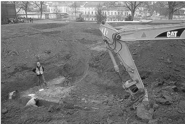
Abb. 3 Bei Sondierungen auf dem Schänzli-Areal in Solothurn kamen Reste der ehemaligen Schanzen zum Vorschein – allerdings nicht dort, wo wir sie erwartet hatten.

me der Lehnfluh (Abb. 4). Diese liegt je zur Hälfte in den Kantonen Bern (Gemeinde Niederbipp) und Solothurn (Gemeinde Oensingen). Auf dem Felsgrat sind heute noch Reste von mindestens vier mittelalterlichen Burgstellen zu erkennen. Lesefunde weisen aber auch auf eine intensive Besiedlung während der Bronzezeit, der jüngeren Eisenzeit und der Römerzeit hin. Eine archäologische Bestandesaufnahme ist deshalb von grösstem wissenschaftlichem Interesse. Diese Arbeit drängt sich aber auch auf, weil die unerlaubten Wühlereien von Schwarzgräbern und Metalldetektor-Gängern in den vergangenen Jahren unübersehbar geworden sind. Diese Raubgrabungen führen nicht nur zu einem enormen Verlust an archäologi-