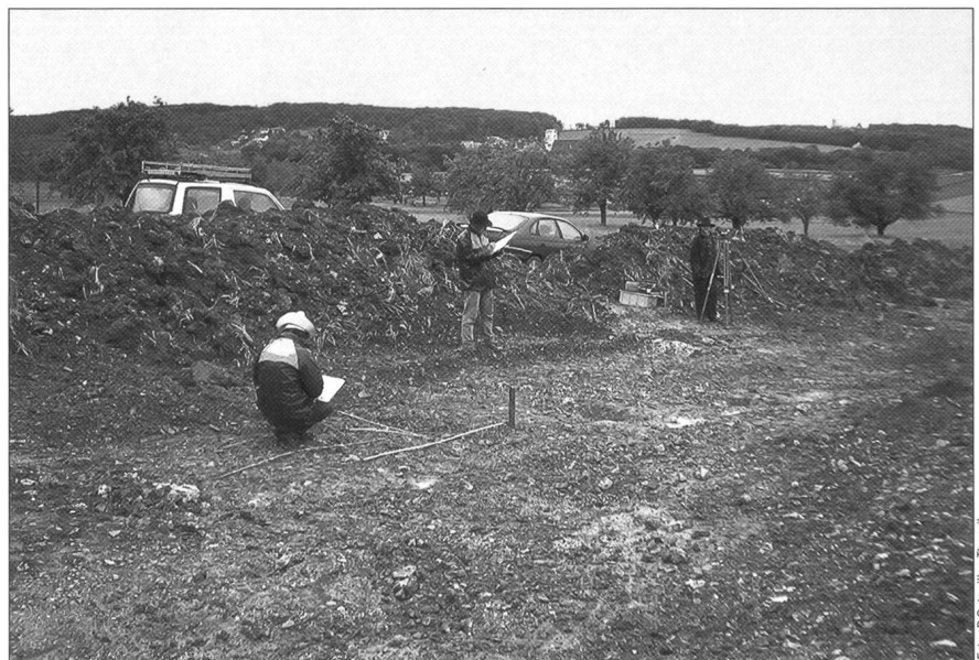
Abb. 1. Regen vom Anfang bis zum Ende! Notgrabung auf der Flur Vorhollen, Gemeinde Hofstetten-Flüh.

Grössere Notgrabungen mussten im Berichtsjahr keine durchgeführt werden, wohl aber mehrere kleinere baubegleitende Untersuchungen sowie Sondierungen im Bereich geplanter Bauvorhaben. In tabellarischer Form gibt Abbildung 2 Auskunft über die archäologischen Entdeckungen des Jahres 2003. Ausführlich berichten wir darüber im Abschnitt «Fundmeldungen und Grabungsberichte 2003», S. 53–80.