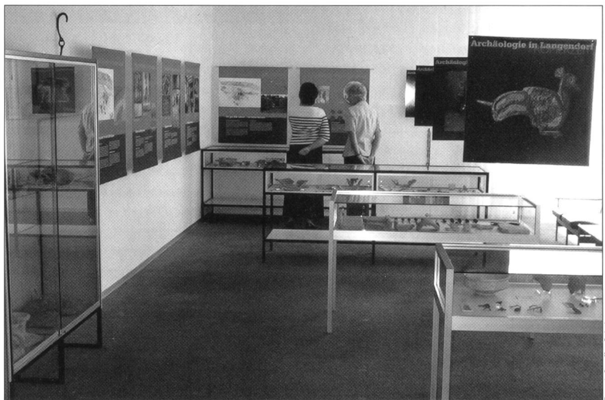
Abb. 6 Blick in die Ausstellung «Archäologie in Langendorf» im Dorfmuseum Langendorf.

Zu sehen waren ausgewählte Funde von der Steinzeit bis in die Neuzeit, dazu Pläne und Rekonstruktionen des römischen Gutshofes und des neuzeitlichen Bauernhofes (Abb. 6). Führungen und Exkursionen ergänzten das Ausstellungsprogramm. Unsere mobilen Ausstellungssammlungen für Schulen, der «Steinzeitkoffer» und die «Römerkiste», waren wiederum während fast des ganzen Schuljahres unterwegs. Insbesondere für die Ausleihe des Steinzeitkoffers konnten wir in den letzten Jahren nicht mehr alle Anfragen berücksichtigen. Mit Lagerbeständen aus den Schubladen «Fundort unbekannt» haben wir deshalb einen «Reserve Steinzeitkoffer» zusammengestellt.