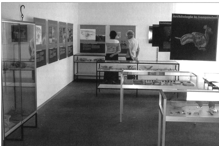
Abb. 6 Blick in die Ausstellung «Archäologie in Langendorf» im Dorfmuseum Langendorf.

Zu sehen waren ausgewählte Funde von der Steinzeit bis in die Neuzeit, dazu Pläne und Rekonstruktionen des römischen Gutshofes und des neuzeitlichen Bauernhofes (Abb. 6). Führungen und Exkursionen ergänzten das Ausstellungsprogramm. Unsere mobilen Ausstellungssammlungen für Schulen, der «Steinzeitkoffer» und die «Römerkiste», waren wiederum während fast des ganzen Schuljahres unterwegs. Insbesondere für die Ausleihe des Steinzeitkoffers konnten wir in den letzten Jahren nicht mehr alle Anfragen berücksichtigen. Mit Lagerbeständen aus den Schubladen «Fundort unbekannt» haben wir deshalb einen «Reserve Steinzeitkoffer» zusammengestellt.