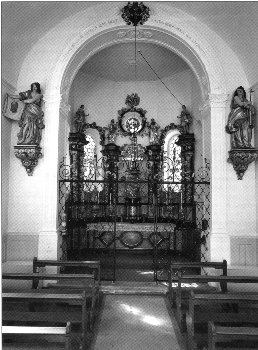
Abb. 1 Solothurn, Altar der St.-Urban-Kapelle nach der Restaurierung 2003 (vgl. auch Farbabbildung Seite 109).

Jahrzehnten in desolatem Zustand ein beschämendes Dasein fristete, gelang es dank des verdienstvollen Einsatzes der römisch-katholischen Kirchgemeinde das hochbarocke Meisterstück restaurieren zu lassen und wieder an seinem angestammten Platz aufzustellen.