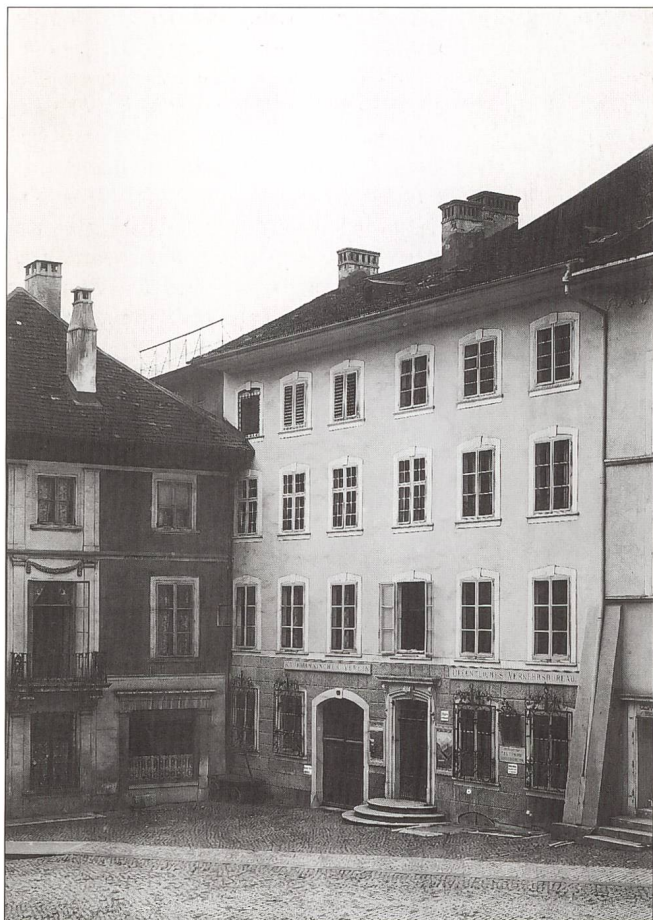
Abb. 4 Solothurn, Hauptgasse 67. Ursprünglich barockes Stadthaus von 1740.