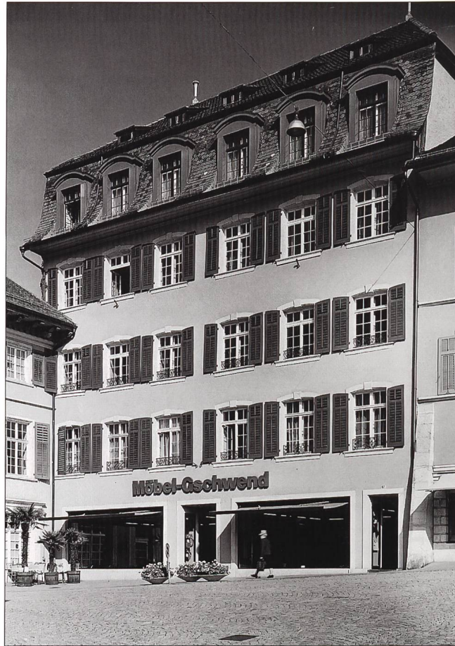
Abb. 6 Solothurn, Hauptgasse 67. Zustand nach der Restaurierung von 1972.