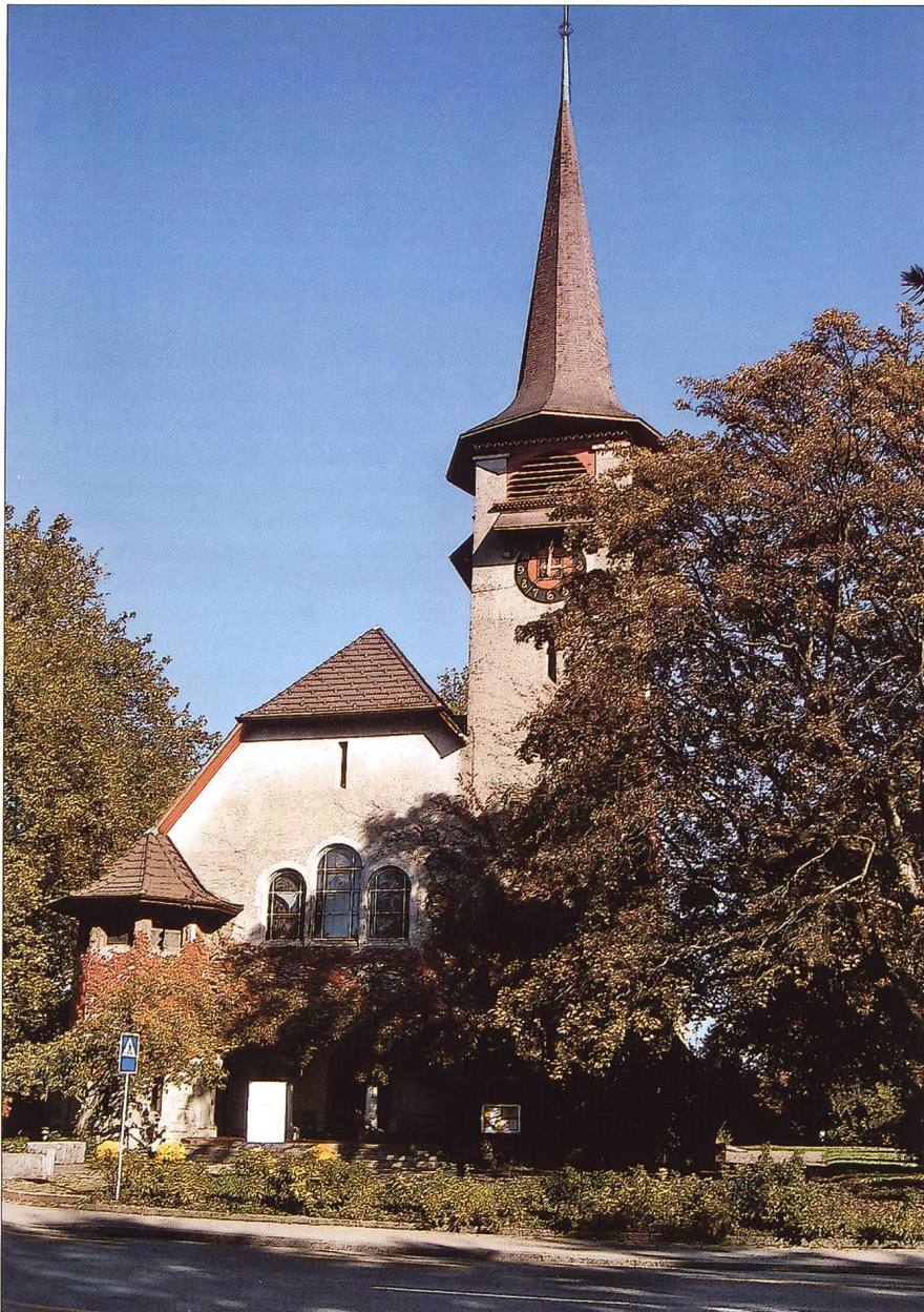
Abb. 1 Biberist, reformierte Kirche.

bewegung um die Wende vom 19. zum 20. Jahrhundert Gedanken zu machen, sondern auch der konzeptionellen Orientierung im Umgang mit historischen Bauten vor 40 Jahren und heute nachzugehen.