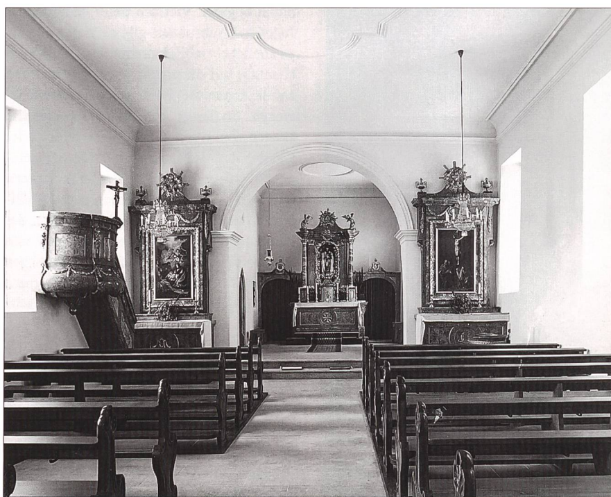
Abb. 3 Kienberg, Pfarrkirche Mariä Himmelfahrt. Zustand nach der Restaurierung von 1972.

In den 1960er und 1970er Jahren fand der Heimatstil zusammen mit dem Historismus in unserem Kanton weder vor den Kunsthistorikern, der Denkmalpflege noch der Bevölkerung entsprechende Gnade. Manche Bauwerke und Umgestaltungen älterer Bauten aus dieser Zeit sind späteren Restaurierungen zum Opfer gefallen. Ein Beispiel stellt die ursprünglich aus dem 17. Jahrhundert stammende Pfarrkirche von Kienberg dar (Abb.