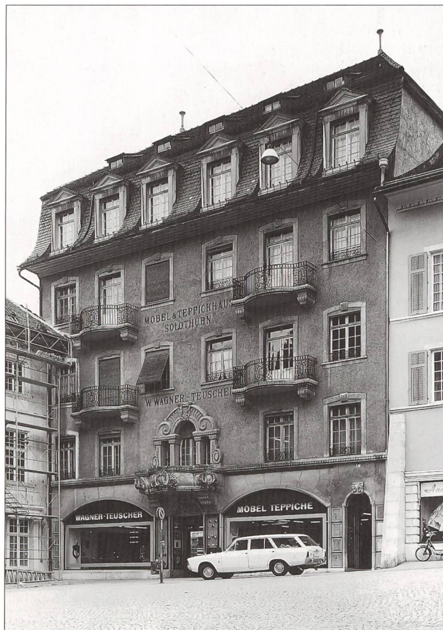
Abb. 5 Solothurn, Hauptgasse 67. Zustand nach der Aufstockung und der Neugestaltung der Fassade von 1916.

eine Nachempfindung eines für manche verloren gegangenen, idealisierten historischen Zustandes. Ähnliches geschah auch andernorts im Kanton mit Umgestaltungen aus der Zeit des Historismus. Als Beispiele zu nennen sind die Häuser Hauptgasse 45 oder Hauptgasse 67 in Solothurn (Abb. 4–6). Beide Fassaden wurden um die Wende vom 19. zum 20. Jahrhundert im Stil der Zeit umgebaut. Dabei wurden nicht nur die Einzelformen, sondern auch die gesamten Proportionen der Fassaden zu einem neuen Gesamtbild verändert. Anlässlich von Restaurierungen in den 1960er und 1970er Jahren wurden die Interventionen aus der Zeit um die Jahrhundertwende als wertlos eingestuft und ein Rückbau vorgenommen. Dies gelang jedoch nur in beschränktem Mass, da die veränderten Proportionen oder Aufstockungen nicht mehr rückgängig gemacht werden konnten. Die erwähnten Beispiele zeugen von der sich immer wieder verändernden Wertschätzung der historischen Kunst im Allgemeinen und der Architektur im Besonderen. Parallel dazu ändert sich stets auch die konzeptionelle Orientierung der Denkmalpflege. In den 1960er und 1970er Jahren erfüllten ausschliesslich die Stilrichtungen bis zum Klas-