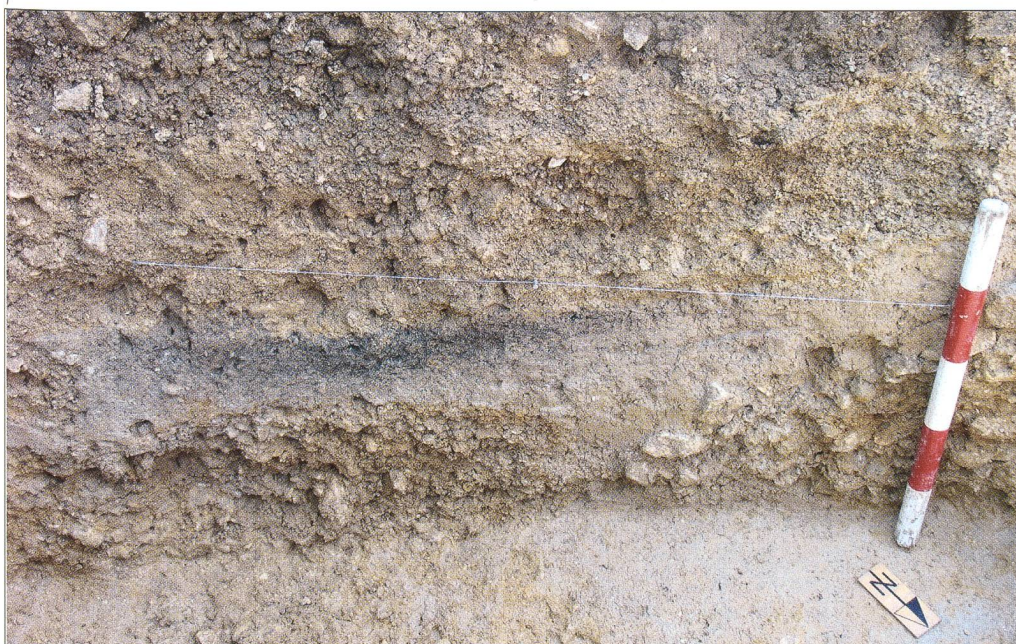
Abb. 1 Die dunkelgraue Schicht mit den Holzkohle- und Mollusken- resten aus dem Mesolithikum.

BP beziehungsweise 5990–5720 v. Chr. (ETH-29623). Die Lehmschicht ist demnach der Mitte der Älteren Atlantischen Regionalen Biozone (Ammann et al. 1996) zuzuordnen, die im westlichen Teil des Schweizer Mittellandes dem Spätmesolithikum entspricht. Um abzuklären, ob zu dieser Zeit schon Menschen hier lebten, und gleichzeitig mehr über die Umweltverhältnisse, das Klima und die Vegetation zu erfahren, schien uns die Auswertung der Molluskenschalen die vielversprechendste Methode.