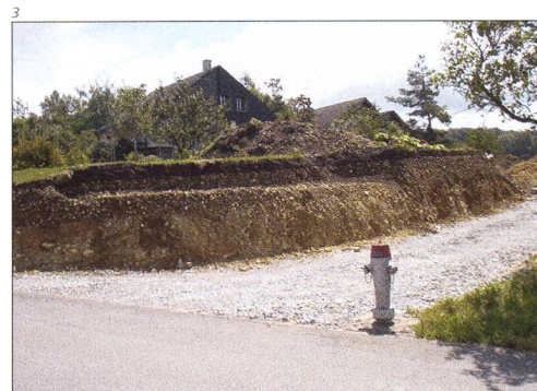
Abb. 1 Boningen / Fahrweg 41. Mauer eines älteren Speichers und Rollierung oder Versturzs- schicht, gegen Süden.

Andreas Schrade aus Reinach BL meldete der Kantonsarchäologie im Mai 2005, dass er im Profil der Zufahrtsstrasse zu einer Baustelle einige spätmittelalterliche Tonscherben und Eisenschlacken gefunden habe. Als ich am folgenden Tag den Bauplatz aufsuchte, entdeckte ich in der unter dem Humus liegenden, braunen, teilweise abgebaggerten Kies-schicht, und auf der Deponie, weitere Eisenschlacken sowie Ofenlehm- und Keramikfragmente. Die Schlacken sind alle durch Korrosion stark verrundet. Darunter befinden sich sowohl Fliessschlacken, die beim Verhütten des Eisenerzes anfallen, als auch Kallottenschlacken, wie sie beim Reinigungsprozess des Roheisens durch mehrmaliges Ausschmieden entstehen. Obwohl auf den benachbarten Parzellen in der Folge noch weitere Neubauten verfolgt wurden, liess sich der Standort einer Eisenhütte nicht näher fassen. PAUL GUTZWILLER