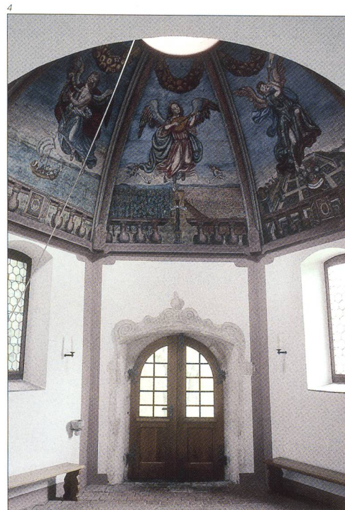
Abb. 4 Malereien des Kuppelgewölbes nach der Restaurierung 2004.

Im Innern der Kapelle wurden der Altar und die Malereien der kuppelgewölbten Decke ebenfalls restau-