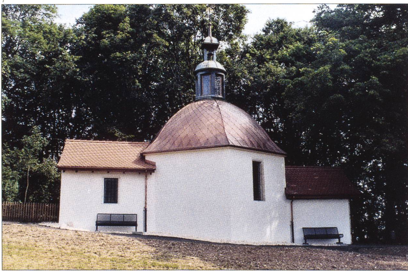
Abb. 1 St.-Anna-Kapelle nach der Restaurierung 2004.

Die St.-Anna-Kapelle in Metzerlen-Mariastein steht am nördlichen Rand eines Plateaus mit Blick auf das Kloster Mariastein und datiert in ihrer heutigen Erscheinung ins letzte Viertel des 17. Jahrhunderts. Die Kapelle besteht aus einer offenen, mit einer Holztonne überwölbten Vorhalle und einem sechseckigen Kapellenraum mit holzgewölbter Kuppel und Laterne. An den Kapellenraum schliesst ein leicht rechteckiges Chörlein an, das einen dreiteiligen Altar aufnimmt.