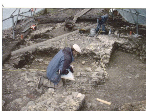
Abb. 6 Oberbuchsiten / Bachmatt. Die Grabung im Hinterhof des Bauernhauses.