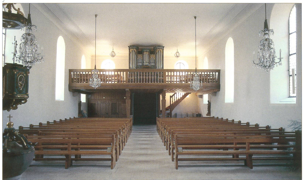
Abb. 4 ... und nach der Restauration 1973.

Malers Melchior Paul Deschwanden auch eine Kanzel sowie ein Taufstein gehörten.