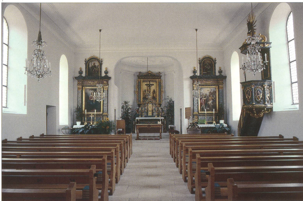
Abb. 1 Nuglar-St.Pantaleon, Pfarrkirche nach der Innen- restaurierung 2005/2006, Blick nach Osten in den Chor.

Die Pfarrkirche in St.Pantaleon entspricht dem in ländlichen Regionen des Kantons verbreiteten Typus der schlichten Saalkirche mit Polygonalchor und Käsbissenturm. Ihre heutige Erscheinung geht im Wesentlichen auf den Neubau des Chors 1859 und die gleichzeitige Erneuerung der Innenausstattung im neugotischen Stil zurück. Die Kirche bildet mit Kirchhof, Propstei und Pfarrgarten sowie Meierhaus und den nördlich anstossenden Häusern eine geschlossene architektonische Gruppe.