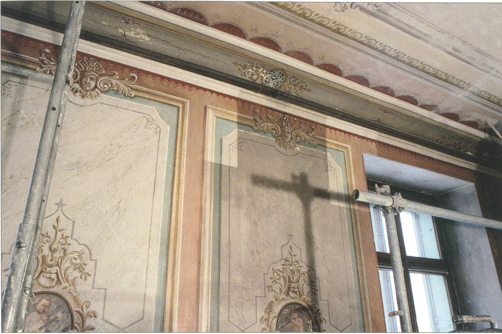
Abb. 16/17 Das Treppenhaus während der Restaurierung 2005. Deutlich sind die gereinigten von den verschmutzten Stellen zu unterscheiden.