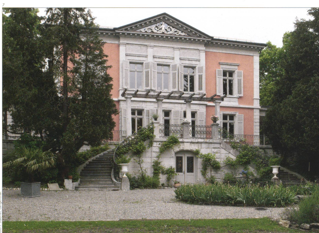
Abb. 7 Ansicht Südfassade nach der Restaurierung 2005.