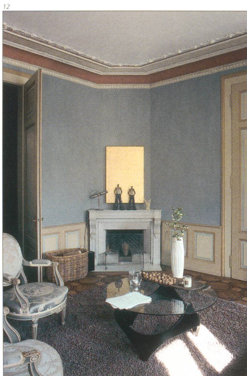
Abb. 13 Südostzimmer im Erdgeschoss. Detail der verzierten Gipsdecke nach der Restaurierung 2005.