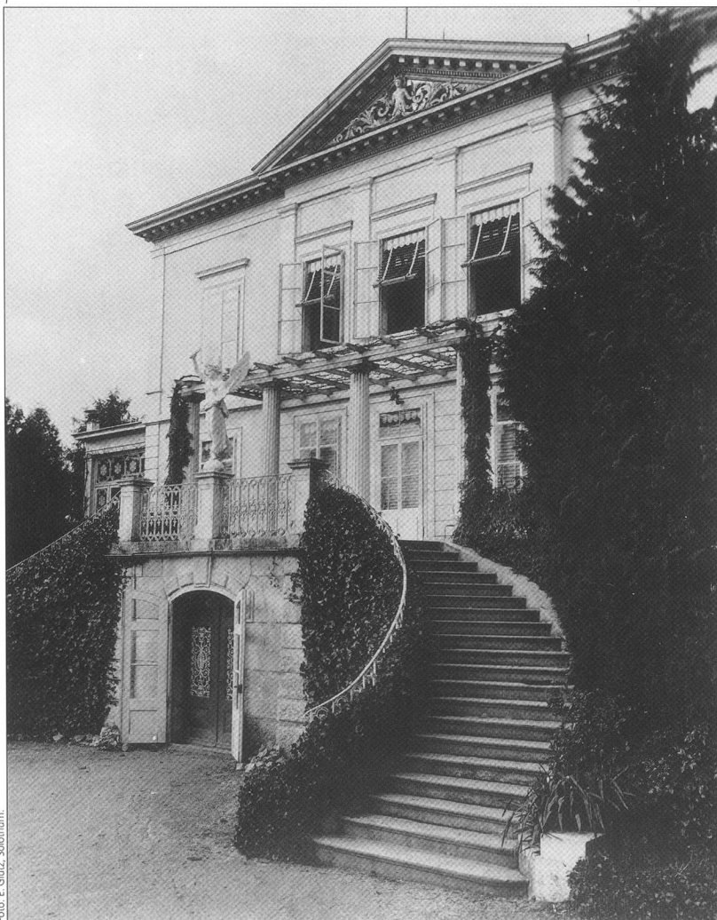
Abb. 1 Solothurn, Mühleweg 1, Villa Riantmont. Ansicht von Südosten um 1900.

Auf einem markant nach Süden abfallenden Grundstück im westlichen Steingrubenquartier errichtete 1870–1872 ein unbekannter Architekt für das Ehepaar Johann und Katharina Kaiser-Hänggi ein herrschaftliches Wohnhaus in spätklassizistischem Stil. 2 Der zweigeschossige Bau mit seitlichen Veranden besitzt auf drei Seiten schlichte Fassaden mit Ecklisenen und Konsolfries an der Dachtraufe. Repräsentativer gestaltet ist hingegen die Südfassade mit ihrem pilastergeschmückten und giebelbekrönten Mittelrisalit