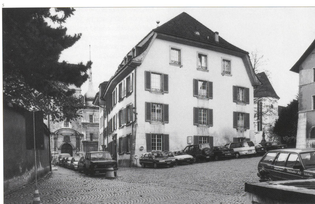
Abb. 5 Ansicht von Südosten vor der Restaurierung von 2005/06. Foto 1996.

In Kenntnis und Würdigung der Baugeschichte des Hauses verfolgte die Denkmalpflege bei der jüngst durchgeführten Fassaden- und Dachsanierung das