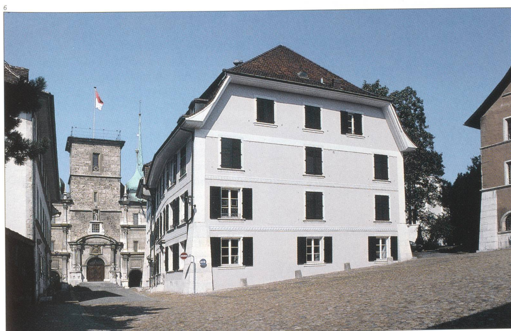
Abb. 6 Ansicht von Südosten nach der Restaurierung von 2005/06. Foto 2006.