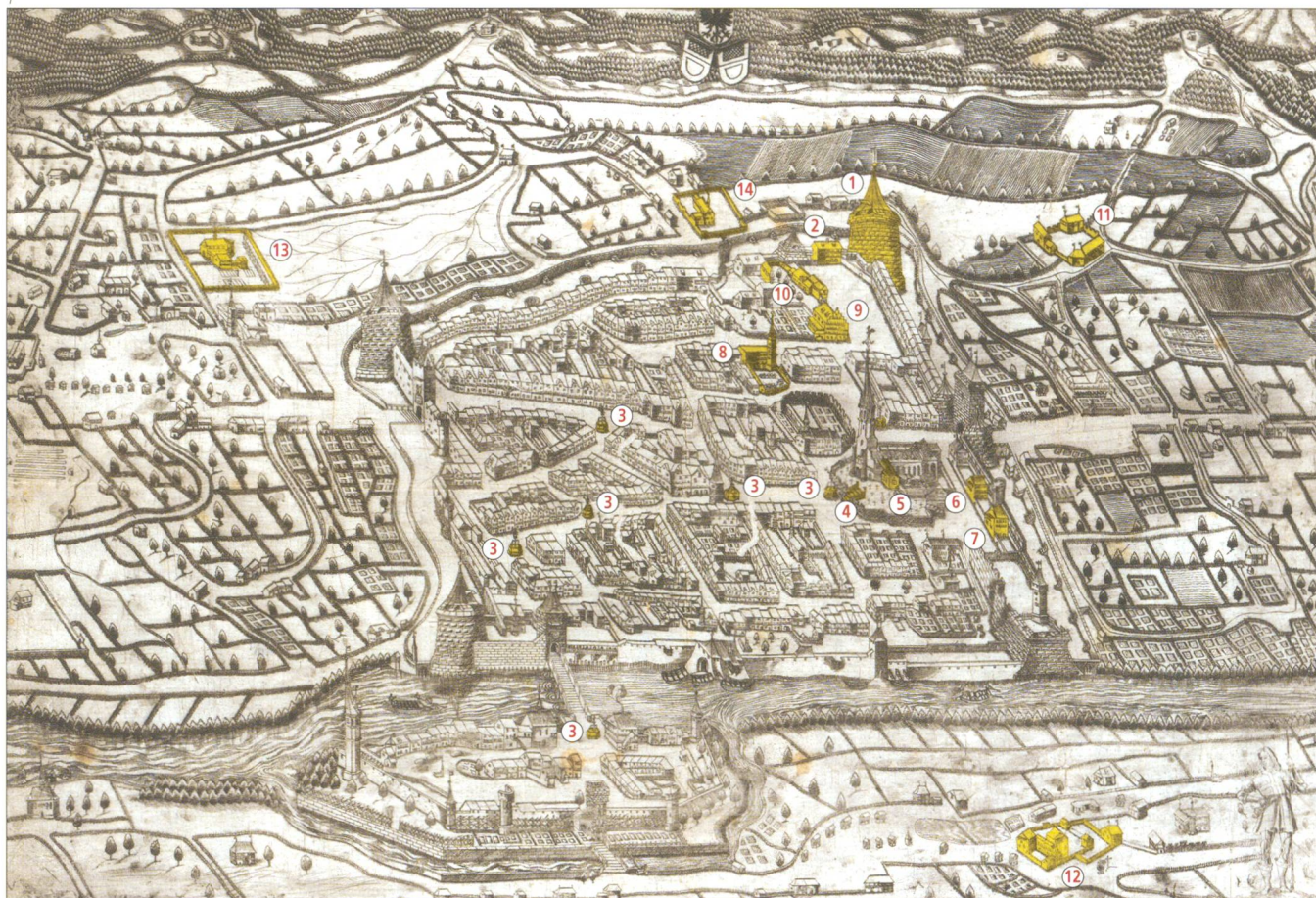
Abb. 1 Der Stadtprospekt von Sickinger/König mit den eingefärbten Bauten, die für die Datierung des Blattes hilfreich sind.