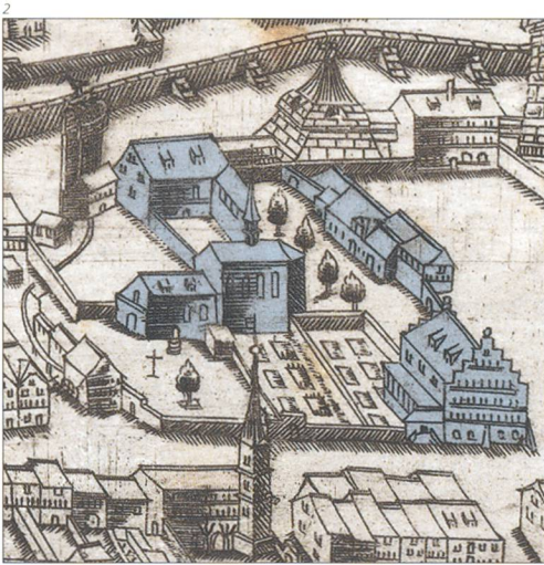
Abb. 2 Zeughaus, Ambassadorshof und Franziskanerkloster. Das Zeughaus erscheint mit einem markanten Treppengiebel an der Südfassade. In dieser Form wird es im 1609 verfassten Werkvertrag mit den Baumeistern beschrieben. Vom Ambassadorshof sind die 1611 neu gebauten Stallungen im Ostflügel erkennbar, der Nordflügel von 1618–1620 steht noch nicht. Ausschnitt aus Sickingner/König (Sammlung Weber, Bern).